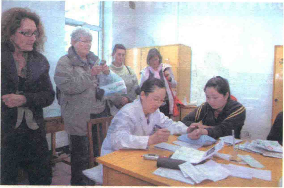
德国中医考察团参观高慧门诊（2008）