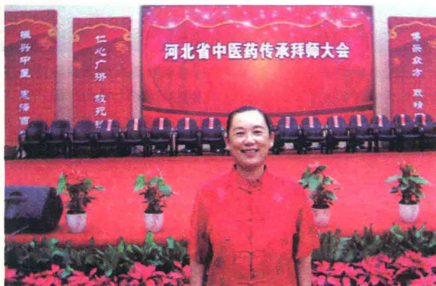
参加河北省中医药传承拜师大会（2012）