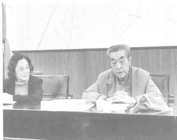
王佩英教授(左)与苏民教授(右)