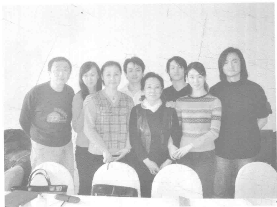
舞蹈表演理论与实践教程研究课题组成员