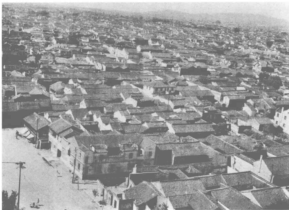
苏州住宅区鸟瞰图