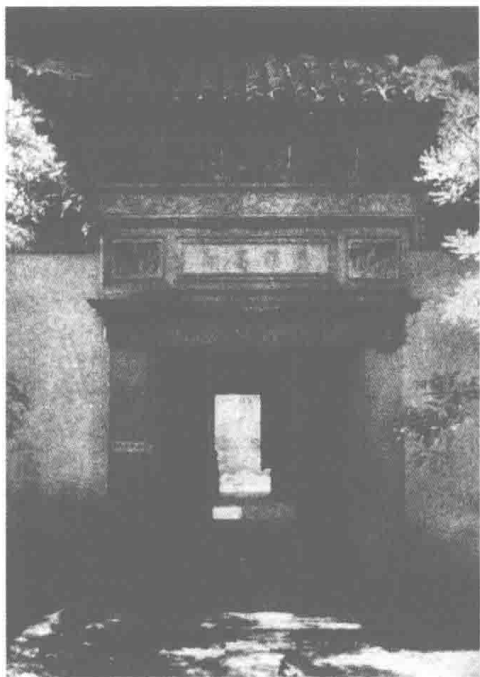
阊阶头巷网师园大厅门楼

廖家巷刘宅，南向，东门，其平面为H形，楼厅三间，左右夹厢，前后各列两厢，厅前两侧者，东首为门屋，西首为书斋。是厅西隔避弄为一面阔三间楼厅，前辅以两厢，厅西书斋前后两间，此建筑虽由两组合成，但又可分别使用，宅东南两面设大门。厅后有“日”形楼屋，天井小，通风光线皆差，系红纸作坊，因主人经营此业。作坊旁为厨房及货房等地，更西有一小园。