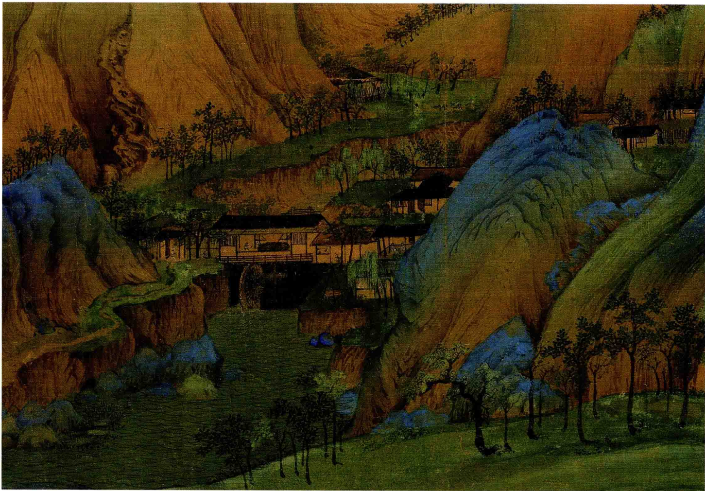
● 王希孟 《千里江山图》局部 北宋 约 900 年前