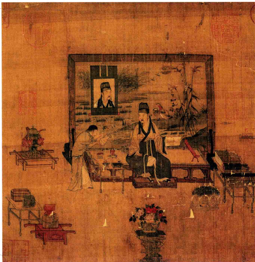
● 佚名《宋人人物册》之一 北宋 约900年前