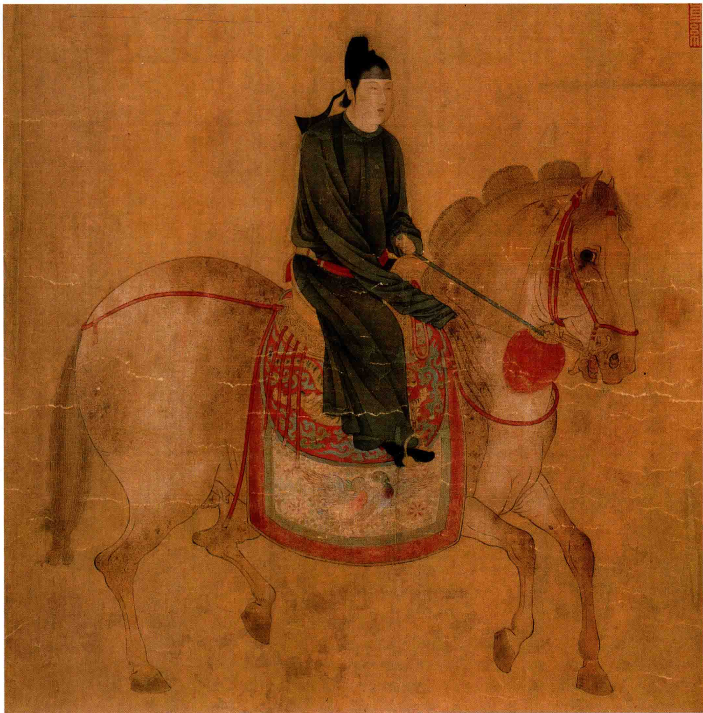
● 张萱 《魏国夫人游春图》摹本局部 唐代 约1200年前