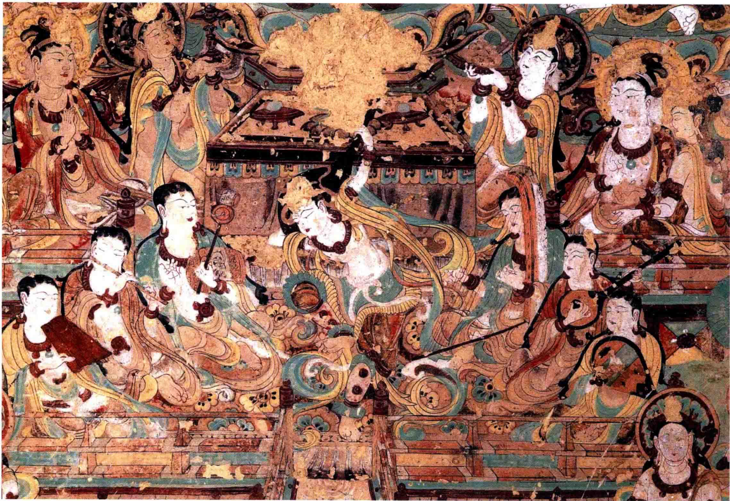
● 敦煌莫高窟第112窟《观无量寿经变之舞乐》唐代 约1100年前