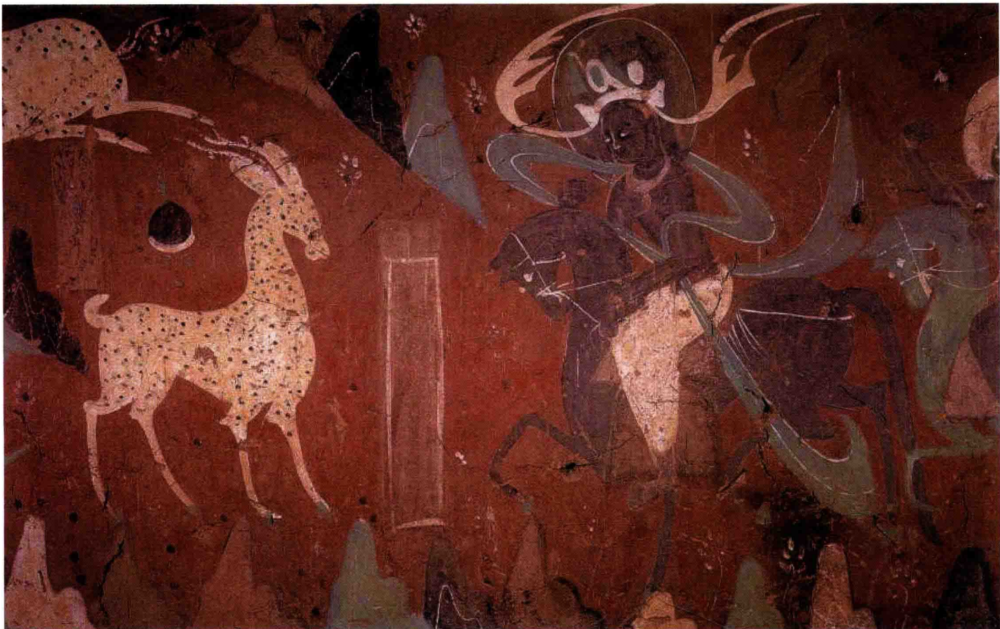
● 敦煌莫高窟第 257 窟 《九色鹿本生图》局部 北魏 约 1500 年前