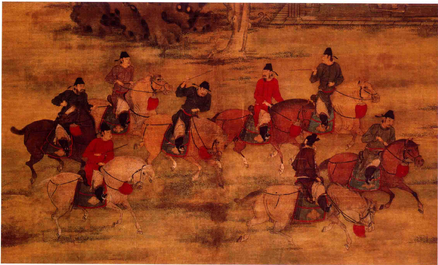
● 赵岳 《八达春游图》局部 五代十国·后梁 约 1100 年前