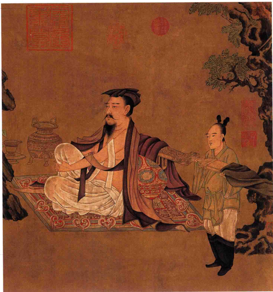
● 孙位 《高逸图》局部 唐代 约 1100 年前