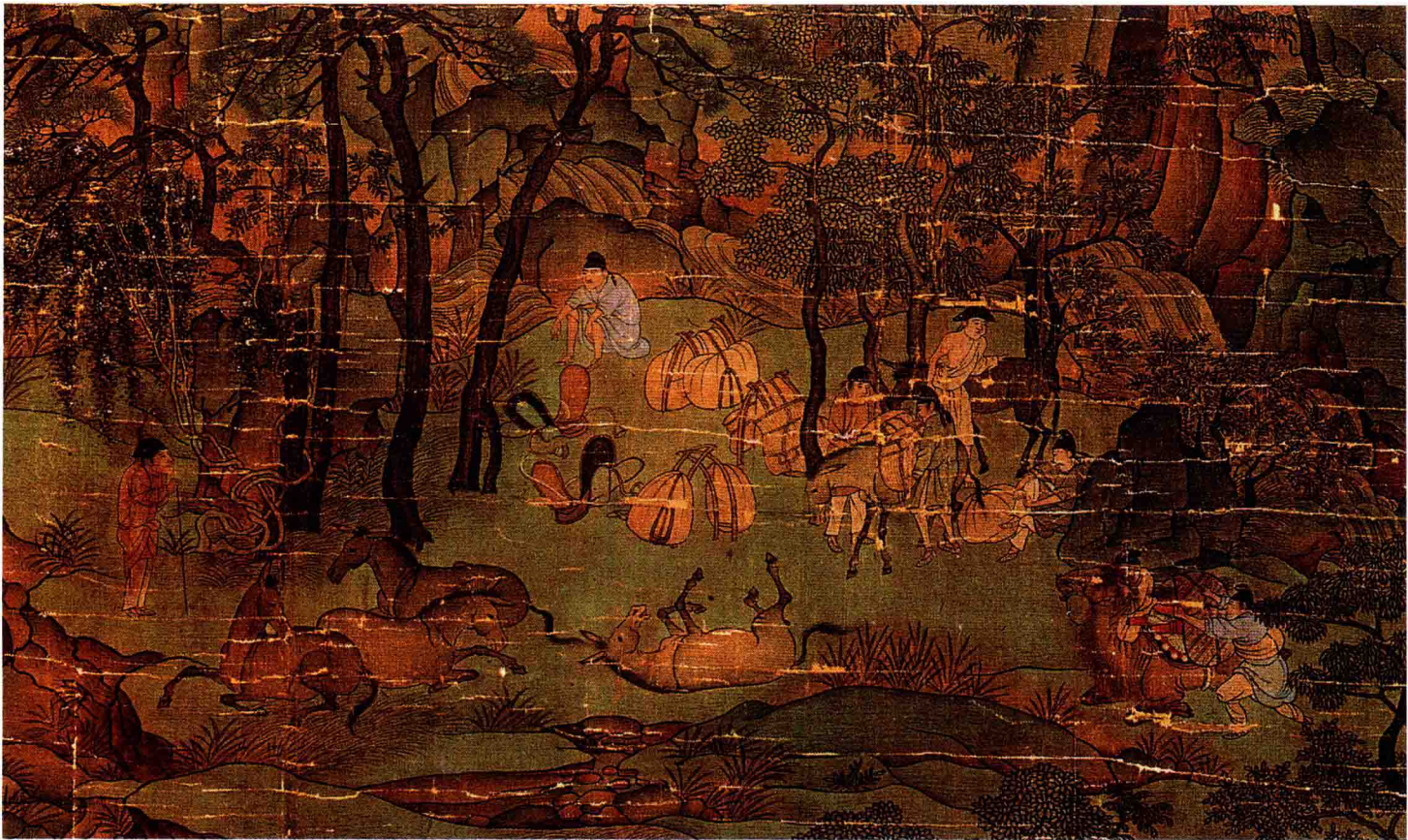
● 李昭道（传）《明皇幸蜀图》摹本局部 唐代 约1200年前