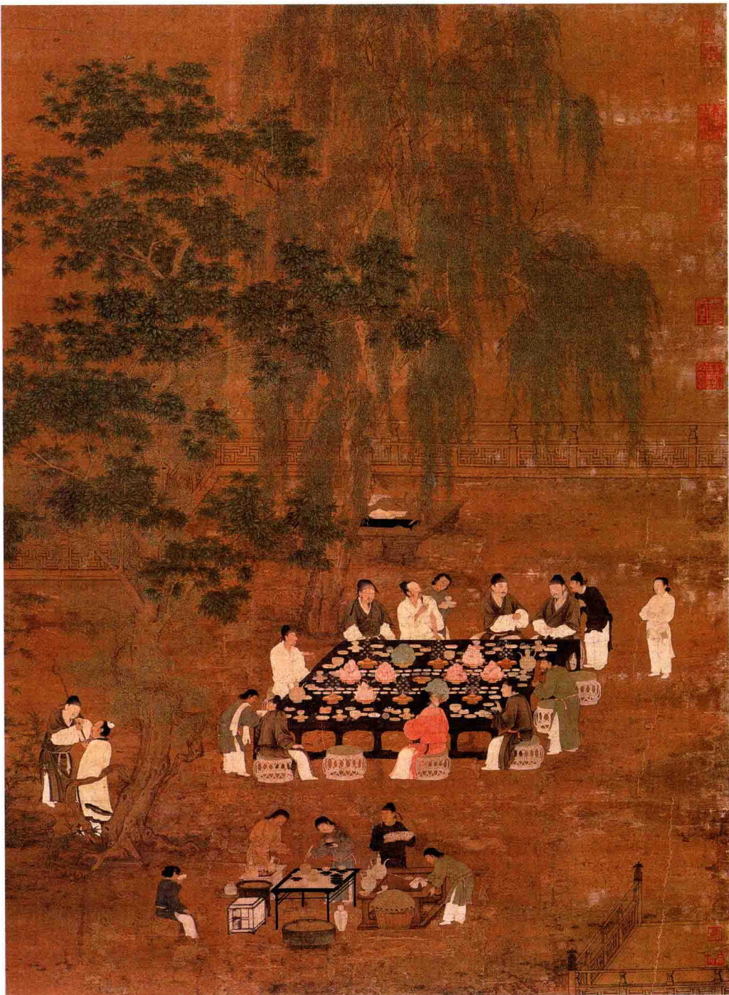
● 赵佶 《文会图》局部 北宋 约 890 年前

大桌前还设有小茶桌，几个仆人正在准备茶点。中间那个青衣童仆手持长柄茶勺，将茶水分到每个杯中。有趣的是，左下角还坐着一个青衣童仆，可能是渴极了，他左手端碗，右手扶膝，自己先喝上了。