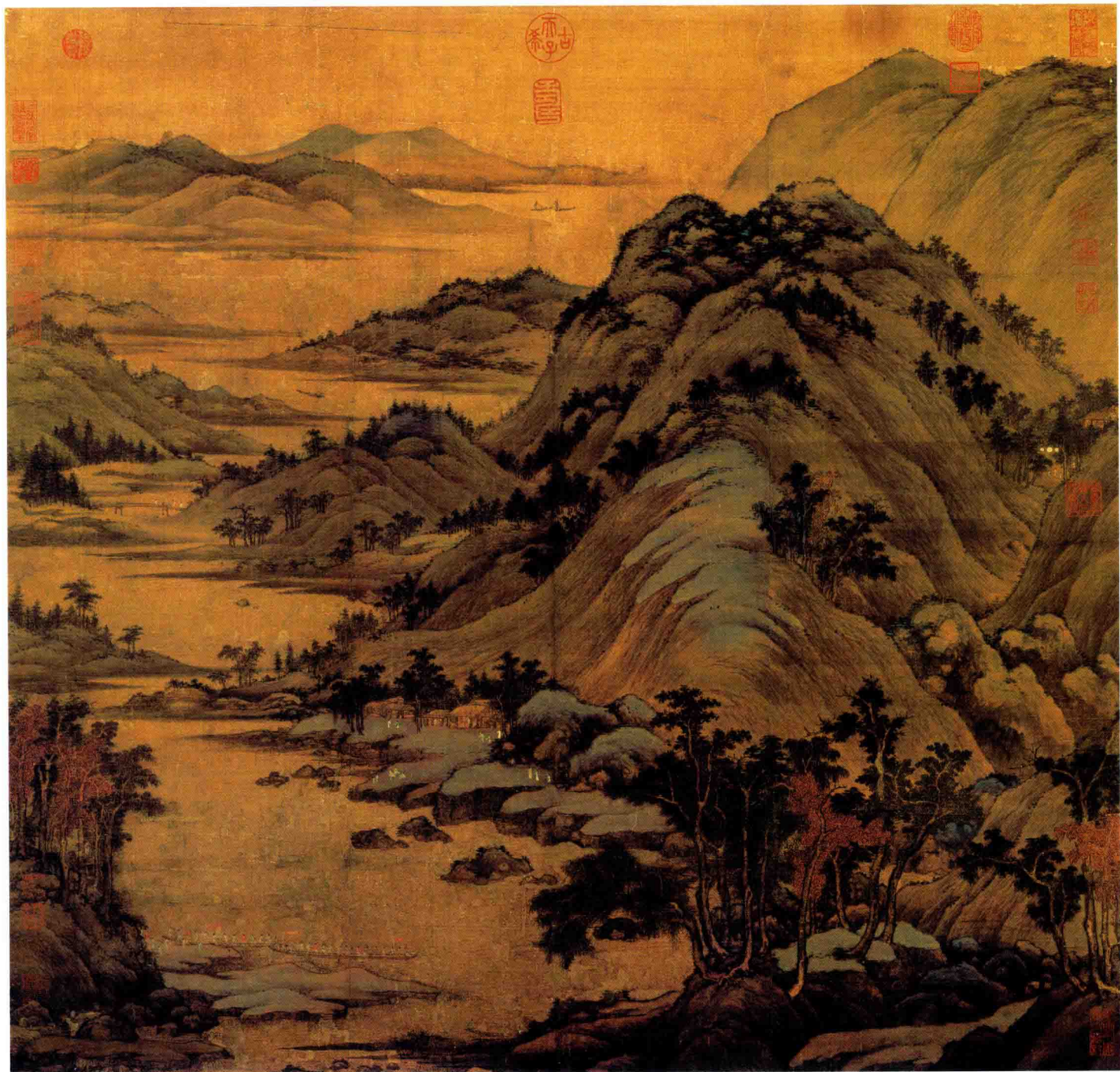
● 董源 《龙宿郊民图》 五代十国·南唐 约 1000 年前