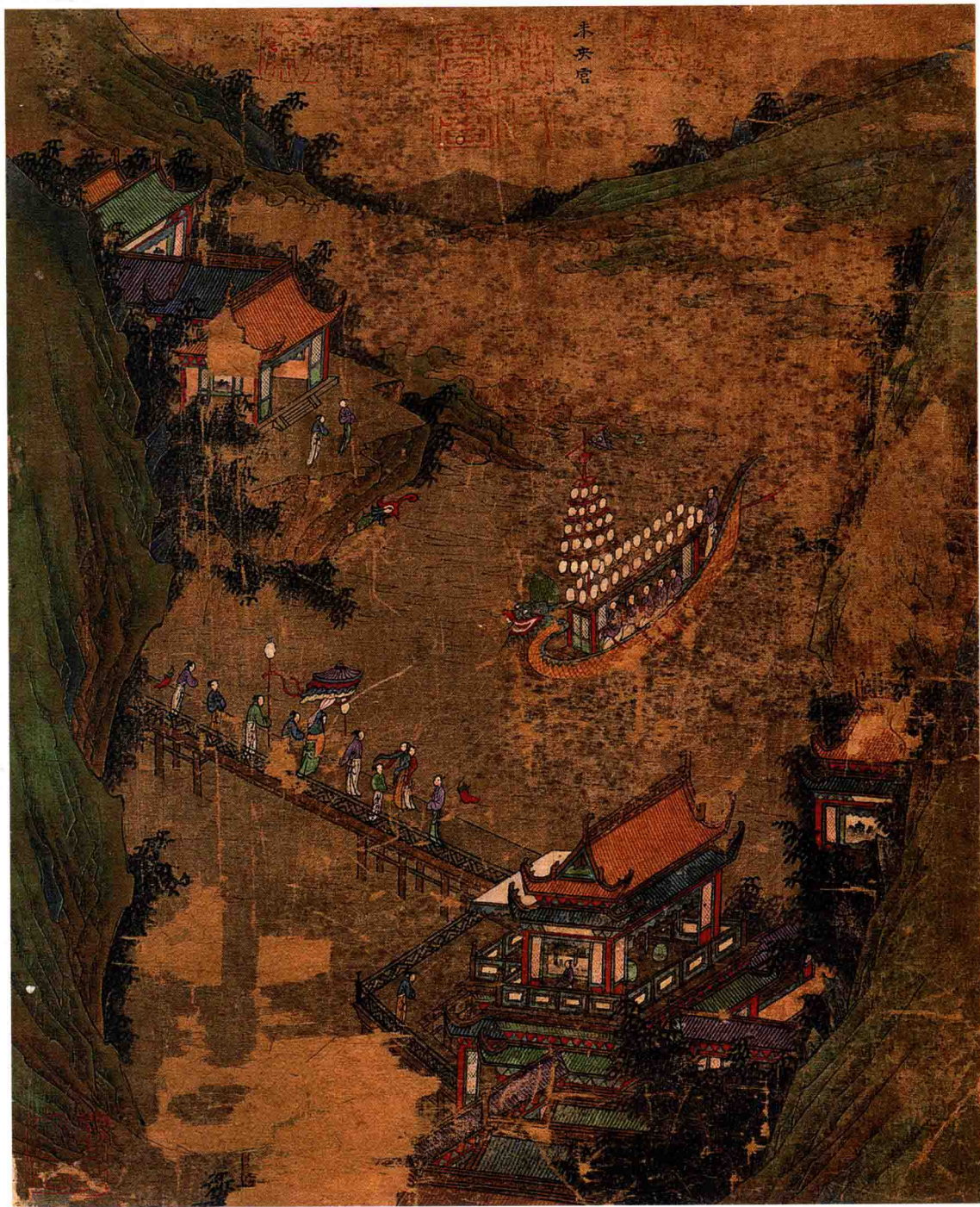
● 李思训（传）《长安宫阙图册·未央宫》 唐代 约1300年前