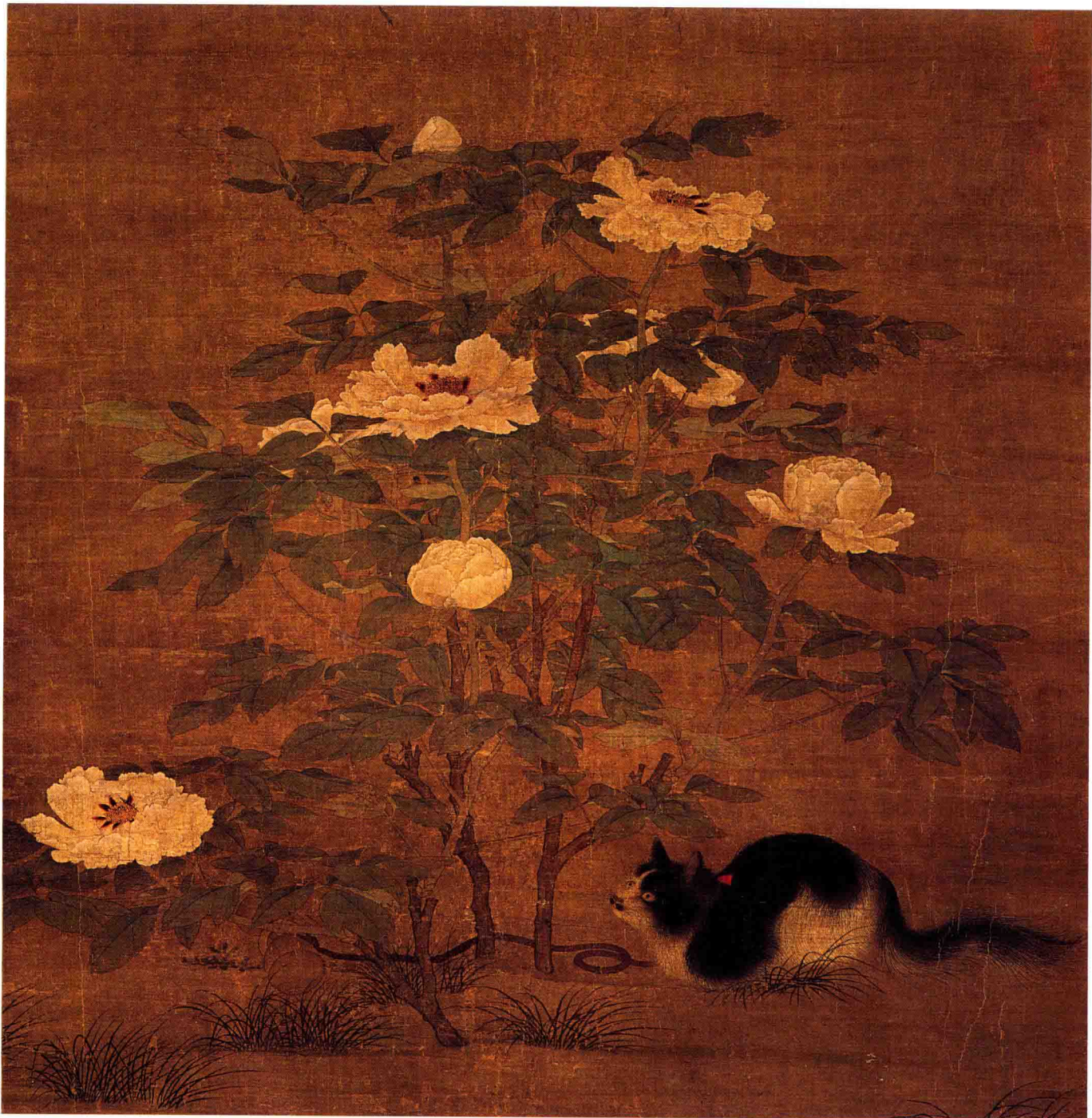
● 佚名《富贵花狸图》局部 北宋 约890年前