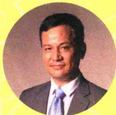
刘丹青 中国社会科学院语言研 究所所长