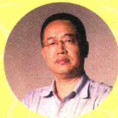
刘祥柏 中国社会科学院语言研 究所教授