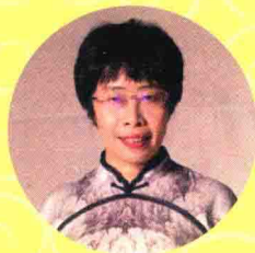
蒙曼 中国社会科学院语言研 究所研究员、博士生导师