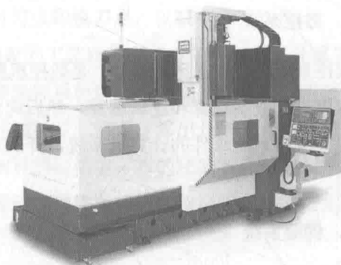
图 1.3.2 数控加工中心

数控机床自问世以来得到了高速发展,并逐渐被各生产组织及其管理者接受,这与它在加工中表现出来的特点是分不开的。数控机床具有以下主要特点。