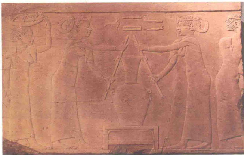
埃及人制造香料油的壁画。这是公元前 2500 年埃及第四王朝古墓一个石灰石刻片片段，目前收藏在卢浮宫。

相较于希腊人，罗马人的用香方式更扩展至日常生活。曾有史书记载，罗马贵族在宴客时，会在鸽子身上洒香水，当飞鸽振翅的时候，空气中就弥漫着香味；非但如此，社会经济地位较高的罗马妇女也有专属的香奴，随时为主人递补各种芳香物品，沐浴、按摩身体或修剪指甲都采用不一样的芳香制品。罗马人的泡澡习惯是出了名的，人们除了建造许多精致的澡堂，还会在澡池里添加月桂、迷迭香，让蒸气缭绕的水气带着香氛。贵族将香料的使用视为一种品味与尊贵的象征，相传罗马皇帝尼禄在他妻子的葬礼中所消耗掉的香料，远比当时阿拉伯十年的总生产量还多！