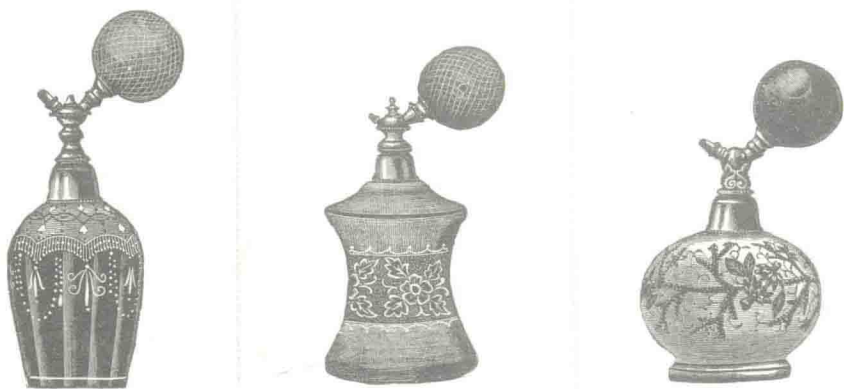
复古的香水瓶。瓶子上方的球状物有泵浦作用，用手挤压，可自喷嘴喷出香水（摘自 1880 年代药妆店目录）

相较于希腊人，罗马人的用香方式更扩展至日常生活。曾有史书记载，罗马贵族在宴客时，会在鸽子身上洒香水，当飞鸽振翅的时候，空气中就弥漫着香味；非但如此，社会经济地位较高的罗马妇女也有专属的香奴，随时为主人递补各种芳香物品，沐浴、按摩身体或修剪指甲都采用不一样的芳香制品。罗马人的泡澡习惯是出了名的，人们除了建造许多精致的澡堂，还会在澡池里添加月桂、迷迭香，让蒸气缭绕的水气带着香氛。贵族将香料的使用视为一种品味与尊贵的象征，相传罗马皇帝尼禄在他妻子的葬礼中所消耗掉的香料，远比当时阿拉伯十年的总生产量还多！