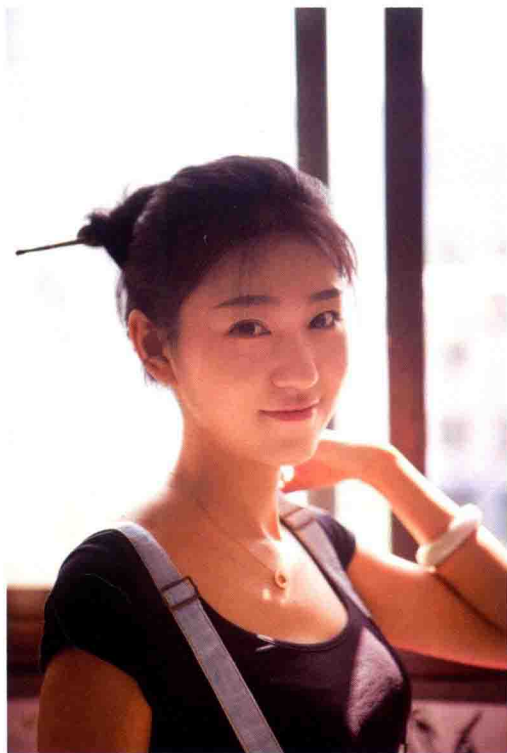
佳能 5D Mark II 光圈: F2.8 焦距: 70mm 快门: 1/250 感光度: 100 曝光补偿: EV 0