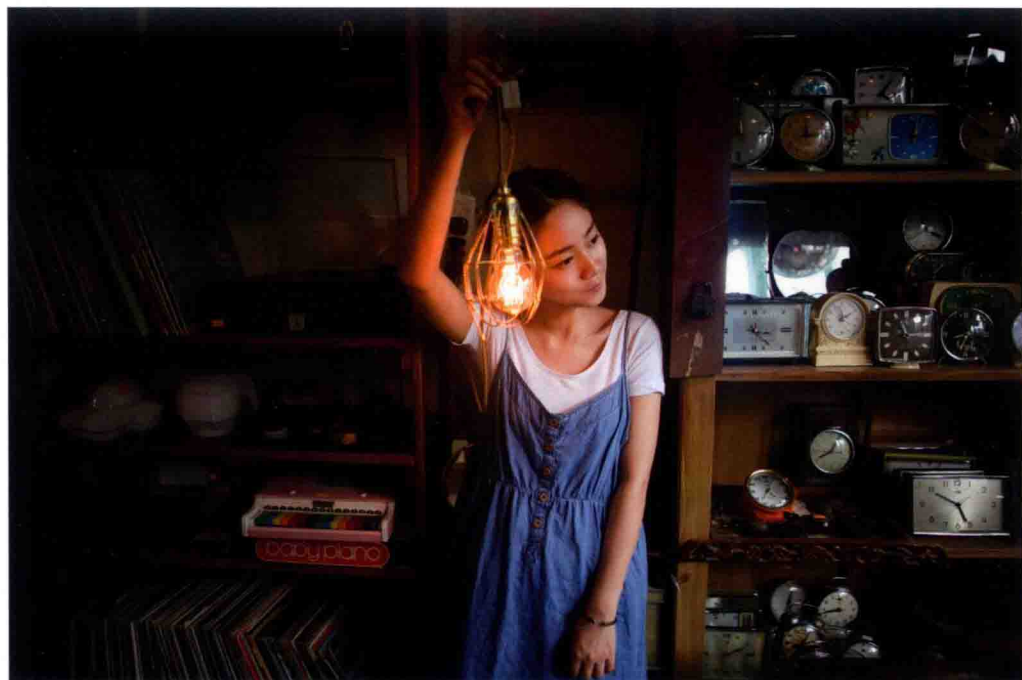
佳能 5D Mark II 光圈：F2.8 焦距：24mm 快门：1/160 感光度：320 曝光补偿：EV 0