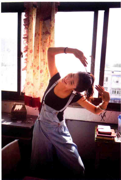
佳能 5D Mark II 光圈: F2.8 焦距: 40mm 快门: 1/400 感光度: 100 曝光补偿: EV 0

唯美人像摄影是拥有庞大爱好者群体的拍摄题材。在生活中找到一处具有特色的拍摄场景，找一身喜爱的衣服，自己画一个淡妆，就可以拍出漂亮的作品。