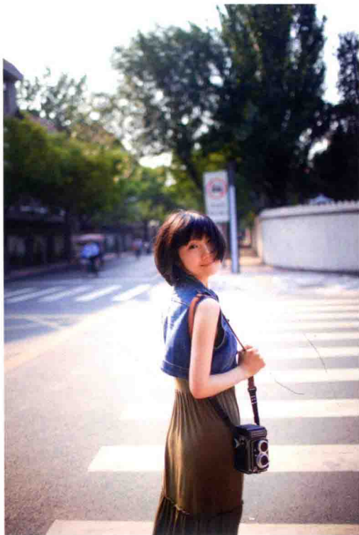
佳能 5D Mark II 光圈：F1.4 焦距：35mm 快门：1/1600 感光度：100 曝光补偿：EV +2/3