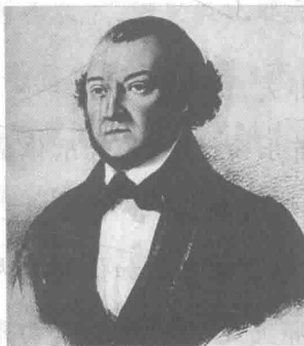
Александр Александрович Алябьев