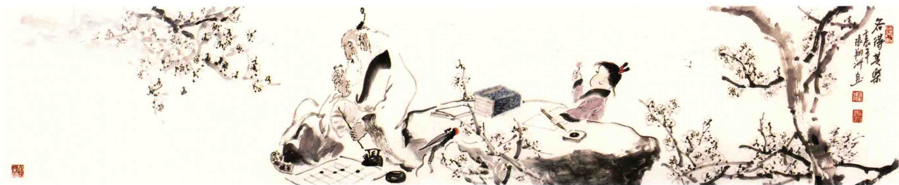
各得其乐 35cm×140cm 纸本设色 2012年