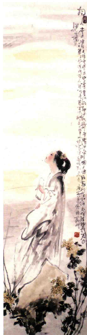
才子佳人（四条屏） 136cm×34cm×4 纸本设色 2010年