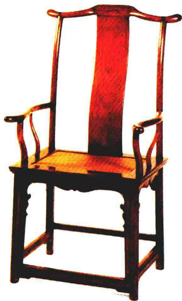
图7 明式四出头官帽椅，作为明式家具的典范之作，该椅整体浑然天成，和谐庄重。横平竖直的交接之间又有弧度自然的搭脑、靠背、扶手、联帮棍，线面处理得当，对比丰富，给人一种秩序感和层次感。