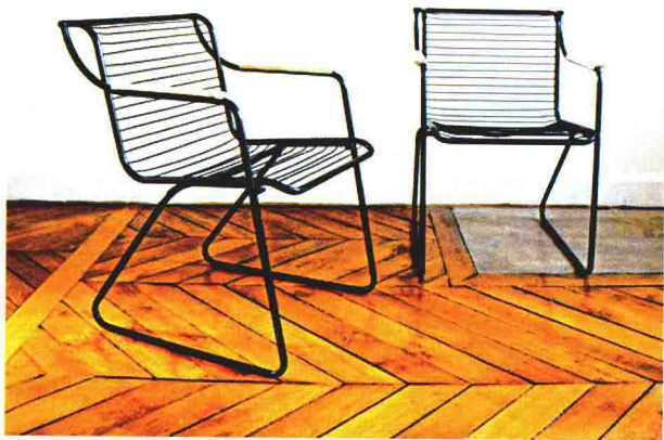
图8 该休闲椅既有造型的变化，又有材质和表现语言的统一。