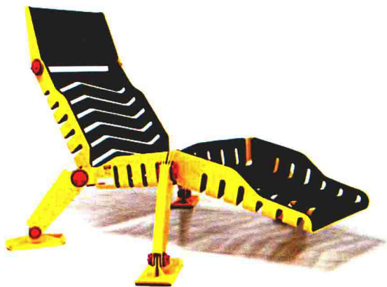
图6 金属件连接结构家具