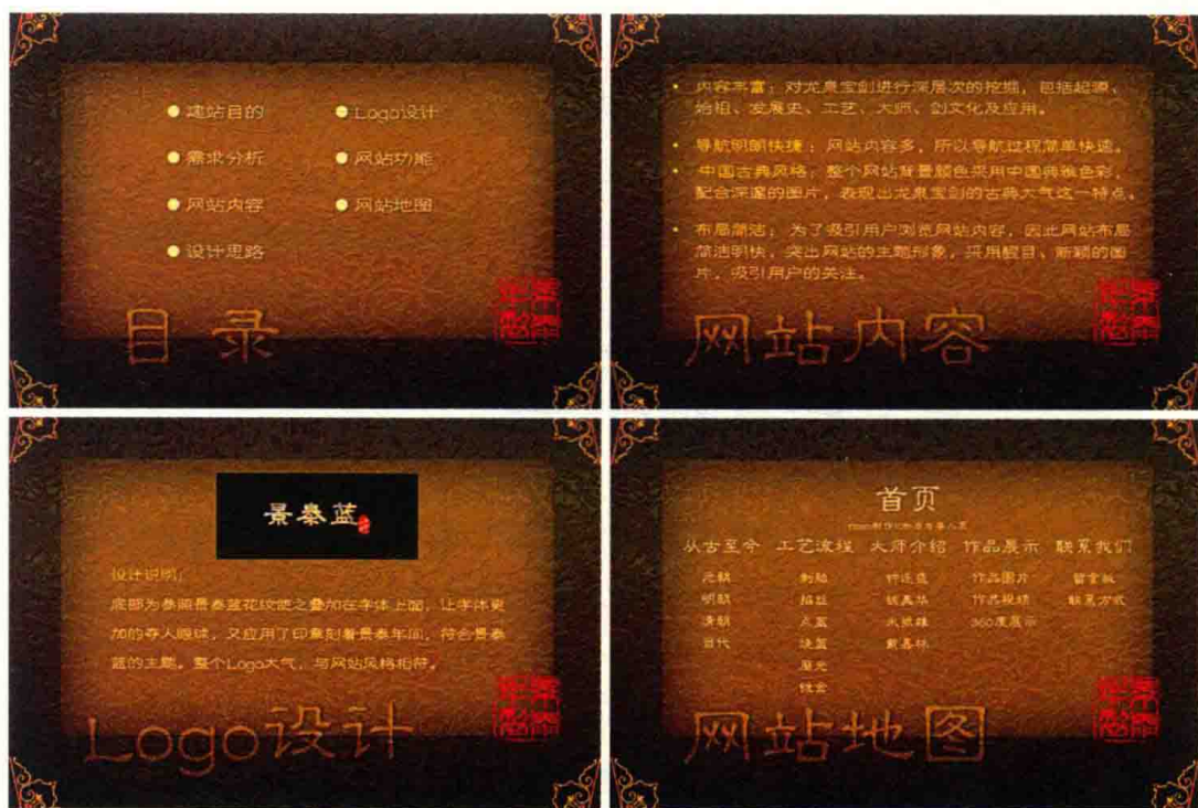
图1-1 景泰蓝网站创意草案