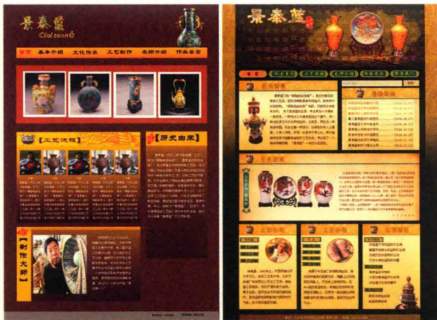
图1-3 《景泰蓝》网站首页设计方案

在设计的过程中能准确表达出视觉创意与网站信息传播的契合度，能领会和掌握创意设计与品牌特征、传播目的、核心信息和受众心理等各传播要素的结合方式，根据传播要素、能根据网站结构规划和风格定位进行主视觉创意构思、配色方案设计和版式布局规划，并以此为基准，贯穿运用于整个网站的设计中。