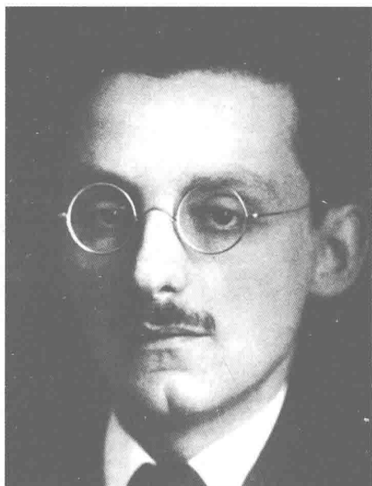
卡夫卡的挚友马克斯·布罗德