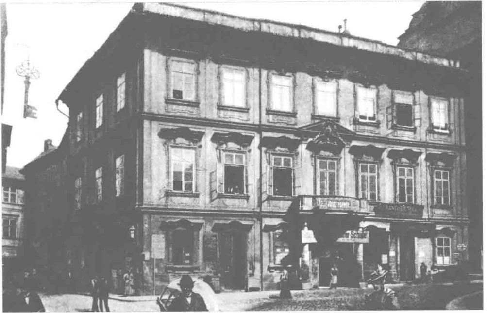
卡夫卡于1883年7月3日生于此楼（布拉格）