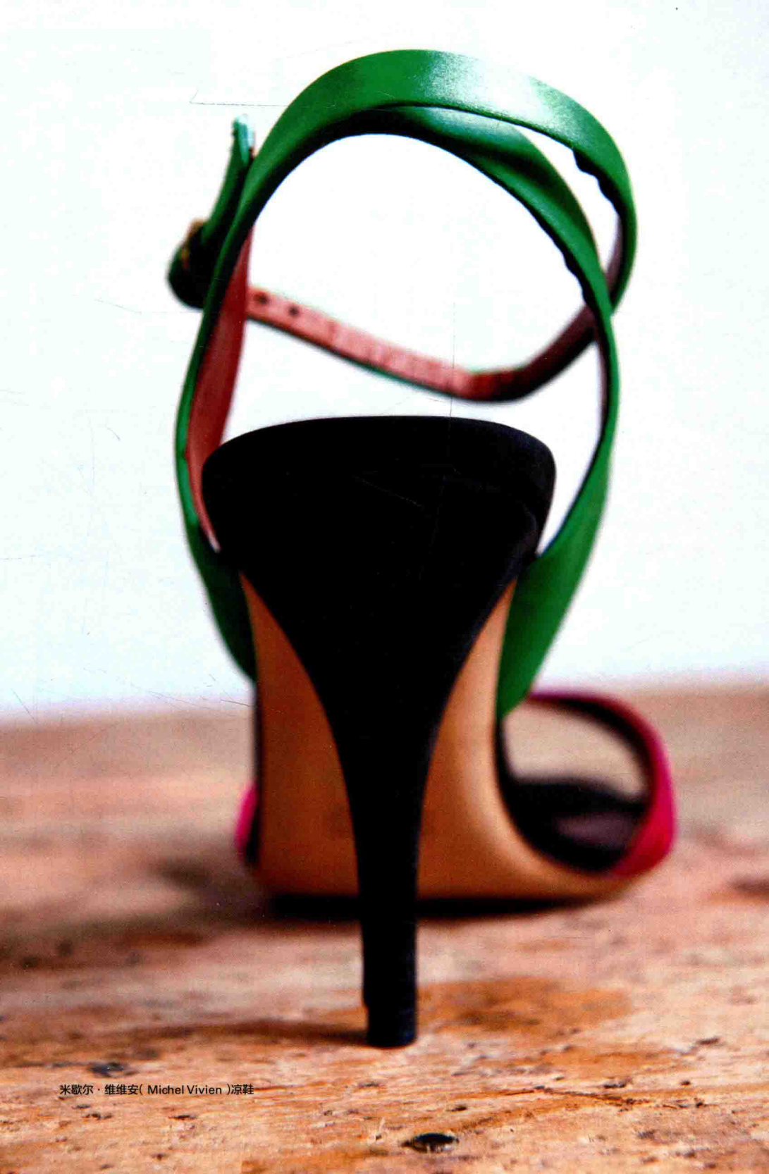
米歇尔·维维安 (Michel Vivien) 凉鞋