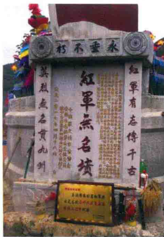
镇宁布依族苗族自治县乐运乡的红军无名坟