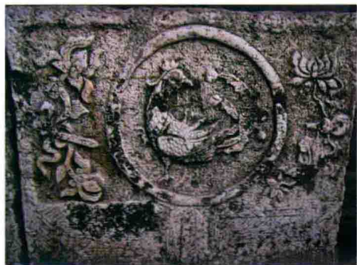
民间传说神凤石雕