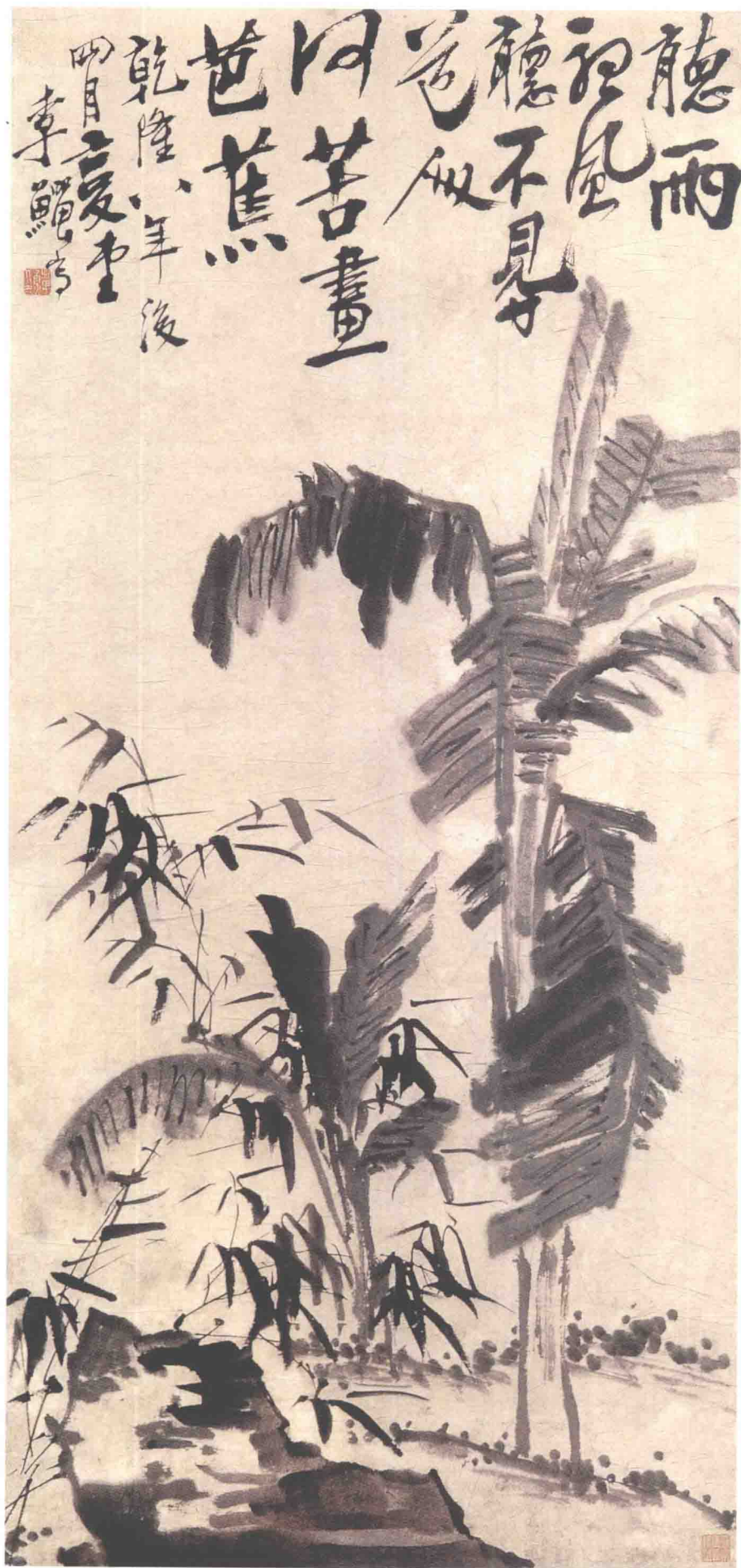
李鱗 风雨芭蕉图轴 清 纸本墨笔 纵129.9厘米 横60.6厘米 苏州博物馆藏

《风雨芭蕉图》轴绘芭蕉茂盛，竹篁葱郁。笔触一改艳丽轻盈的风格，凝重率直，遒劲有力，使作者受谤失官后懊恼悲愤的情绪跃然纸上。作者时年五十八岁。