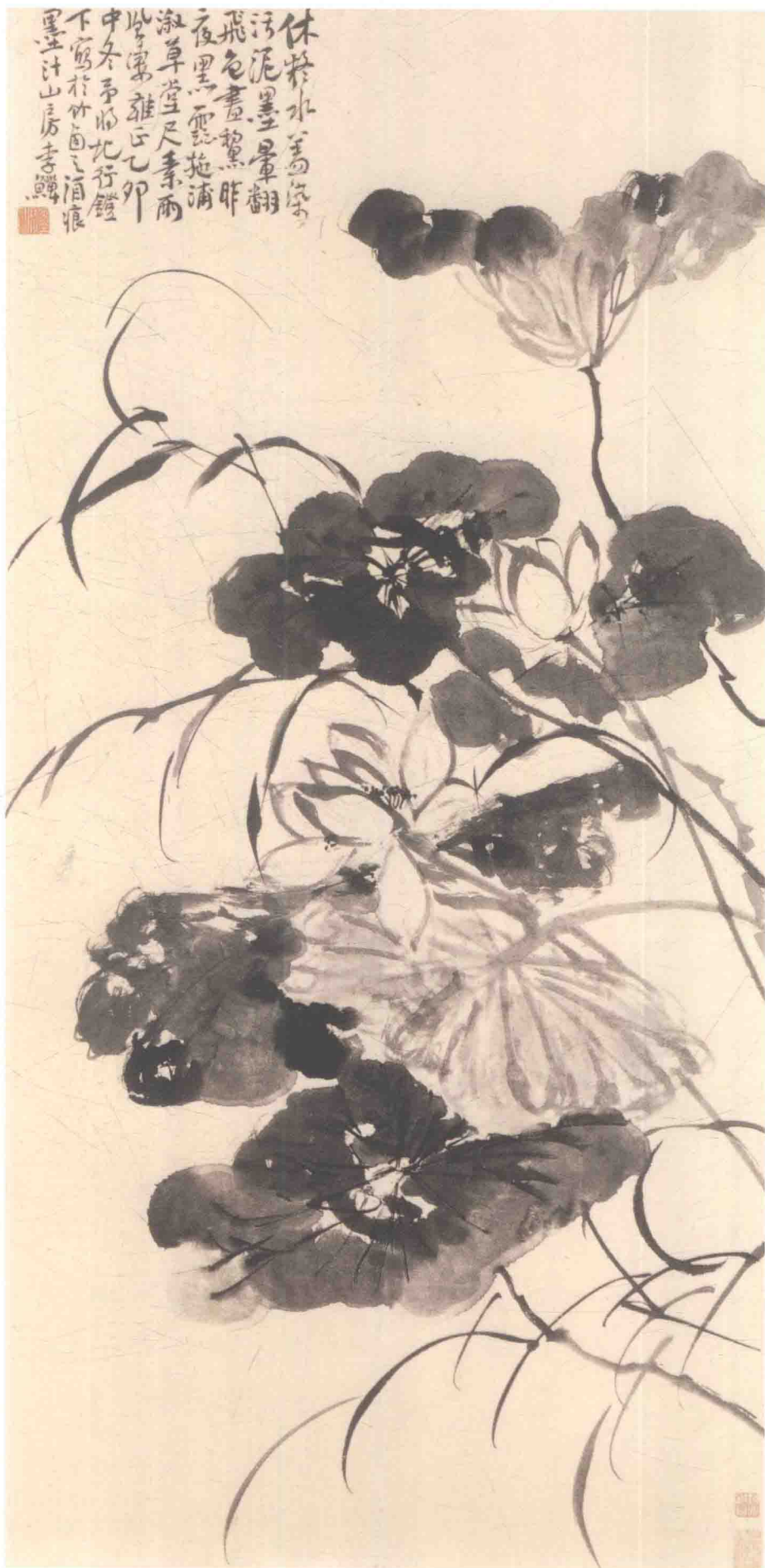
李颀 荷花图轴 清 纸本墨笔 纵125.9厘米 横60.9厘米 上海博物馆藏

《荷花图》轴绘花丛寥落，临水弄影，翻红坠绿，暗合无边秋水。李颀此图可谓笔歌墨舞，虽不及徐渭画荷的爽利恣肆，也不及八大山人的沉厚内凝，但碎笔纷披，线条中锋尖笔着纸，笔高提，上下推拉，左右拨顿，运笔如作草书。画荷叶落墨下笔中锋顿下，破毫左右盘旋，或侧锋提、扫，如灰雾蒸涌，若黑云徘徊。作残叶含茎带露，又湿笔剪花，因其将败，根茎已散，肥叶不胜娇弱，花蕊松散。