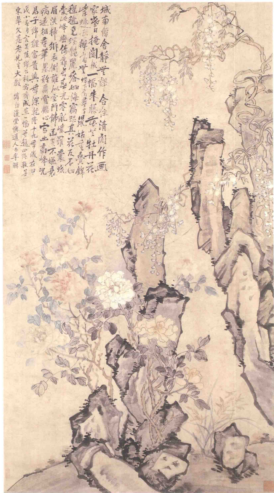
李鱓 朱藤牡丹图轴 清 纸本设色 纵194.3厘米 横106.5厘米 上海博物馆藏

《朱藤牡丹图》轴绘紫藤缠绕，湖石玲珑，任众花留连徘徊。石以拖泥带水皴画成，下笔如斫，顿挫推拉，提笔收锋，锐利劲挺，折角含蓄，偶露锋芒，方而不利，尖而不锐。虽皴笔不多，晕染简洁，但中锋饱满，运笔舒畅。作者时年六十九岁。