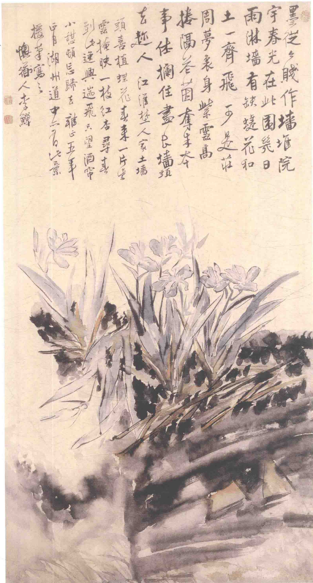
李颿 土墙蝶花图轴 清 纸本设色 纵115厘米 横59.5厘米 南京博物院藏

《土墙蝶花图》轴的土墙以粗笔墨色泼出，蝶花先勾后染。看似信手挥洒，然墨绳有则，笔势纵横，有徐渭风格。空白处有大段题诗，自识：“雍正五年正月湖州道中亦有此景，援笔写之，懊道人李颿。”按清雍正五年为公元1727年，作者时年四十二岁。