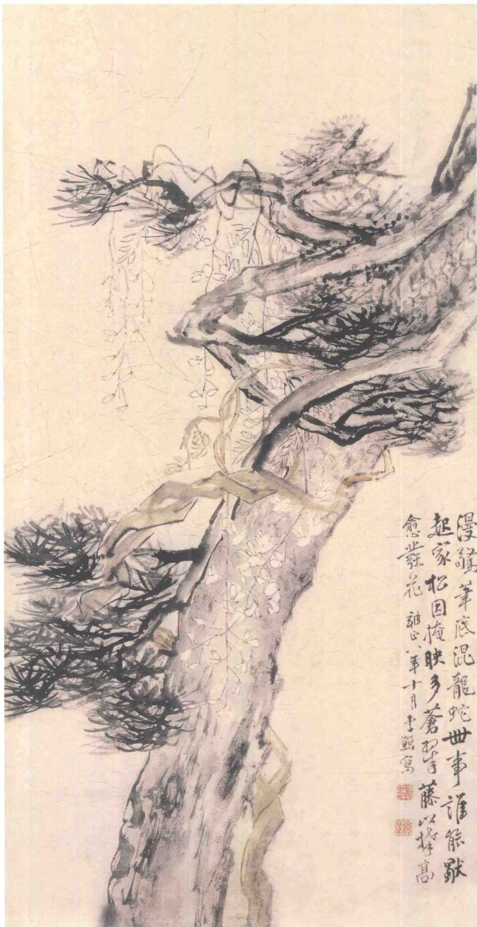
李鱓 松藤图轴 清 纸本设色 纵124厘米 横62.6厘米 故宫博物院藏

《松藤图》轴绘老松一株，枝叶刚劲。枝上藤萝缠绕，藤花盛开。用笔纵横驰骋，信笔挥洒。老松的粗豪、倔强，藤条的精练、清雅，都表现得恰到好处，为李鱓粗笔写意画佳作。