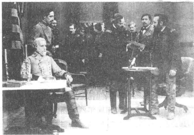
图1 美国电影《一个国家的诞生》剧照

《一个国家的诞生》（见图1美国电影《一个国家的诞生》剧照）是好莱坞1915年以内战和国家重建为题材，摄制完成的第一部达正片长度的无声故事片，其制作技术的娴熟和创新把该片推上了好莱坞经典作品的高度，使之成为故事片发展史中的一座里程碑。该片作为一部世界电影史上备受重视的默片时期的经典之作，被誉为“电影艺术大厦的基石”。该部影片的编剧、导演就是被誉为“电影技巧之父”“好莱坞的缔造者”及“影坛的莎士比亚”的电影巨匠大卫·格里菲斯。影片《一个国家的诞生》以托马斯·狄克森两部种族主义著作《同族人》和《豹斑》为基础创作，描写了美国南北战争时期两个家庭的命运，展现了美国19世纪末20世纪初的社会状况和文化氛围，成为当时社会状况和文化氛围的晴雨表。影片着力反映了这个国家对南方的召唤，召唤其参与到一个新的民族国家的神话中去，而伴随该神话的，则是在一种白人至上的文化中对黑人的尊严和人性进行的恶意诽谤。