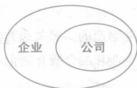
企业与公司关系示意图

公司与企业的关系。公司与企业的关系密切，从组织形式上看：企业的外延要比公司广泛，企业可以采用公司的组织形式从事营业性活动，公司是企业发展到一定程度的高级组织形式；企业也可以不采用公司的组织形式，采取独资企业或合伙企业等形式。换言之，不是所有的企业都是公司，如：在我国现行企业法体系中的个人独资企业、合伙企业、全民所有制企业、集体所有制企业等均不是公司形式。