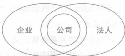
企业、公司、法人关系示意图