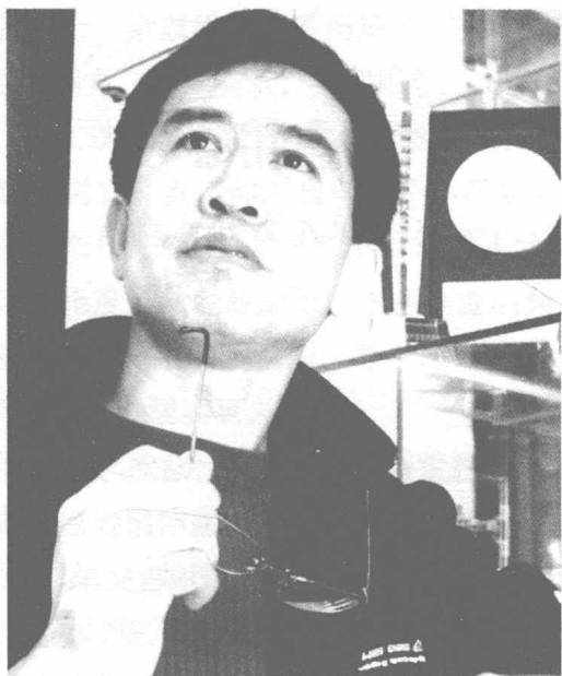
获奖作品《朋友——习近平与贾大山交往纪事》作者李春雷