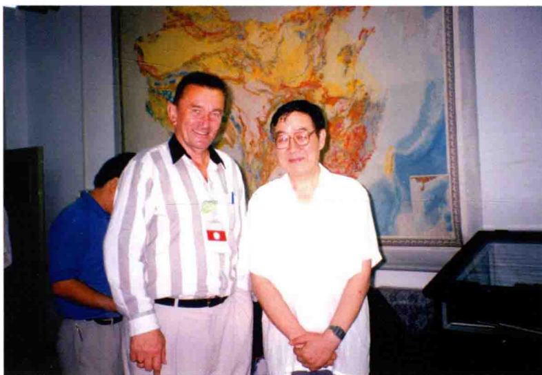
1996年，任与来访的捷克查理大学鲍乌什卡教授