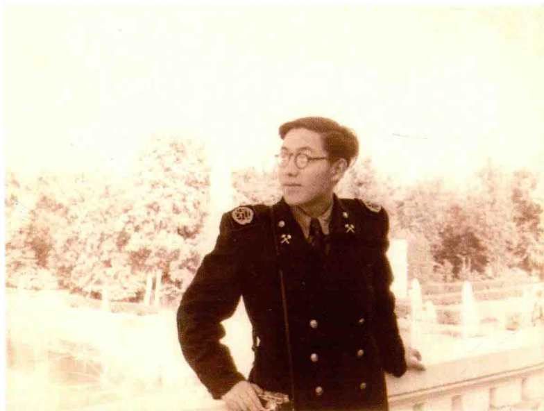
20 世纪 50 年代初，苏联 列宁格勒矿业学院地质勘探系 学生