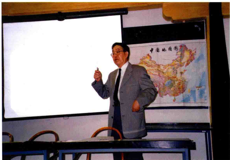
1987年在全苏地质科学 研究院作关于中国煤变质问 题的学术报告