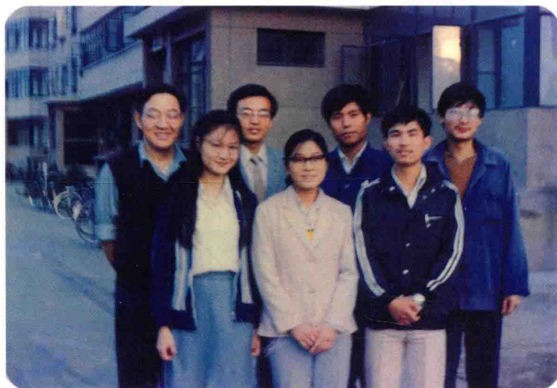
1984年9月30日国庆 35周年阅兵前在老师家门前