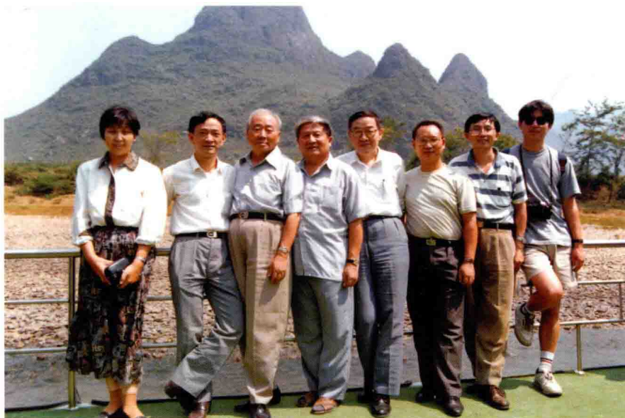
在第四届全国煤岩学会议（1995年，桂林）期间，与同行们共游漓江