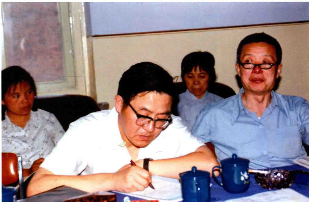
1988年参加黑龙江省哈尔滨煤研所“弱粘煤成因”项目鉴定会