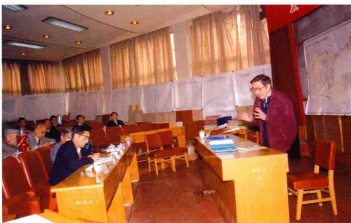
1996年在中国煤田地质总局华北石炭二叠纪课题评审会上发言