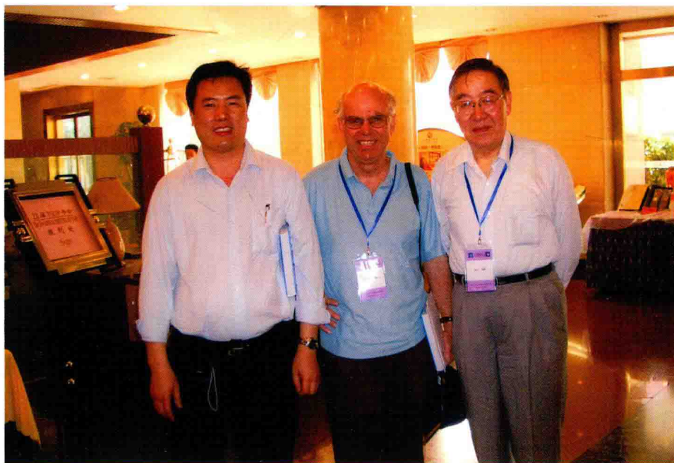
在 23 届国际有机岩石学会议上与澳大利亚沃尔德教授等合影 (2006 年)