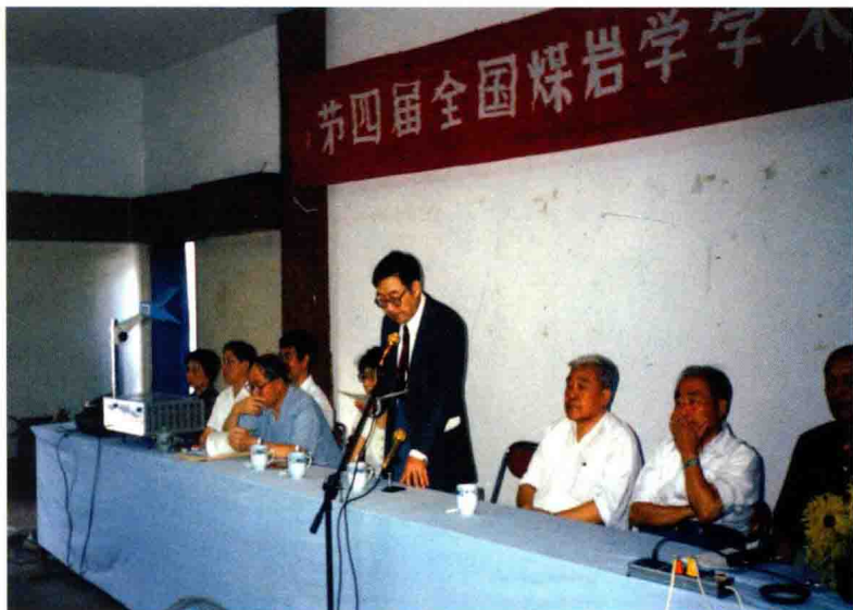
在第四届全国煤岩学会议上发言（1995年）