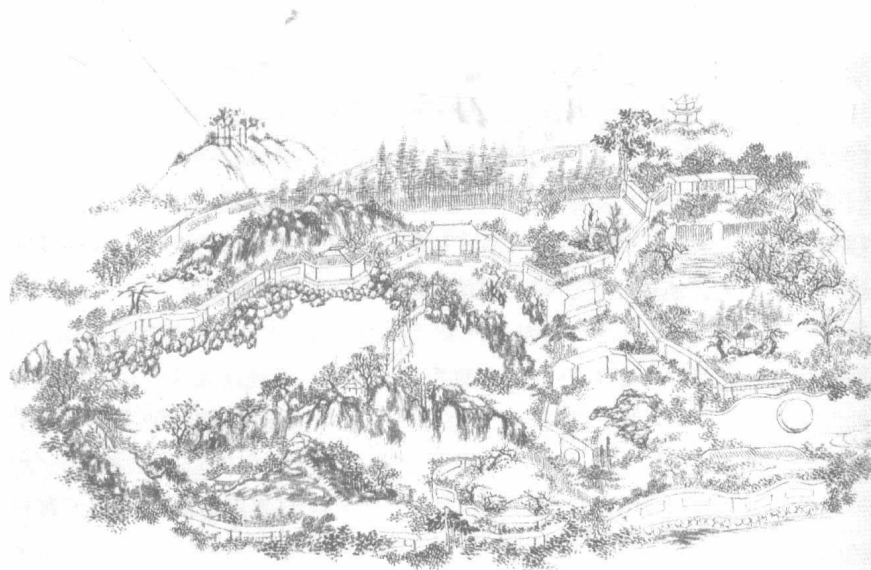
图 0.2 造园示意图

这是陈从周先生收藏的一张造园图。与以往的山水中国画不一样：并不追求构图与笔法的写意，而是重在写实，意在将园林的空间结构表达清楚：园林的外围墙建在哪里，如何划分园子，如何布局组织亭廊、水面、山石与花木，对具体的花窗形式、建筑装饰材料等细节均没有描绘，进行了简化与概括。因此，可以说这是一张用于指导造园组构空间的设计图。