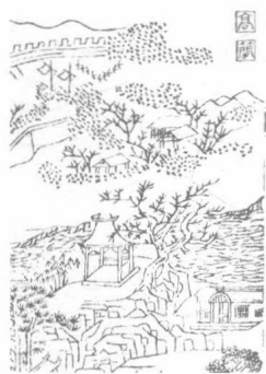
图 0.3 沧浪亭场景局部

然而，景观叙事的效果如何，是否有效地达到预期的目的？这需要一个评测机制。对于文学叙事的效果评测比较熟悉的是通过书的创销量、电影的