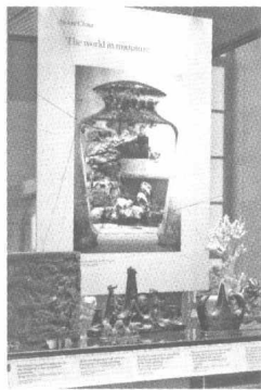
图 0.1 大英博物馆中的豫园照片