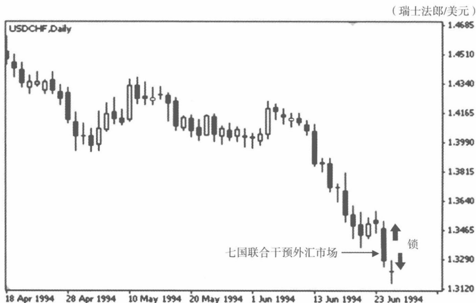
图 0-3 美元兑瑞士法郎走势图

是多么的不寻常。我快步跑到报价机前一看，美元兑瑞士法郎的价格已经跌至 1.3220。