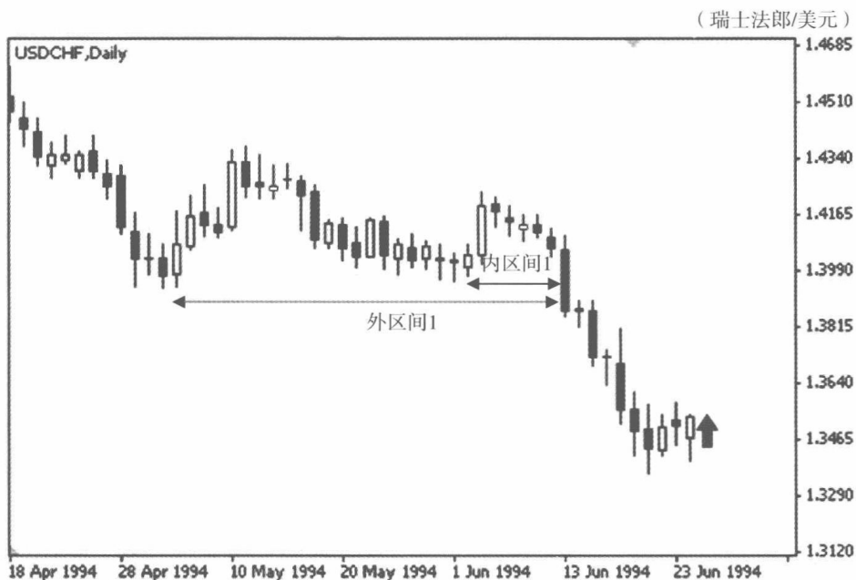
图 0-2 美元兑瑞士法郎走势图

会后，公司几乎所有的客户都忙着建仓，我害怕自己错过了这一千载难逢的盈利机会，当日 17 时左右，也跟随着大家一起，买进了美元兑瑞士法郎，价位在 1.3483。