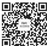
项目管理评论 服务号二维码