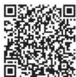
项目管理评论微店

专注于项目管理理论与实务图书、项目管理精品教材的出版。已出版的有项目管理前沿标准译丛、项目管理实用译丛、项目管理经典译丛、项目管理前沿系列、项目管理实务系列、项目管理基础实用系列、项目管理精品文库、项目管理资质认证系列、高等学校项目管理系列规划教材等。