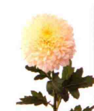
淡色或分离多有微妙色差的菊花品种出有人气，品种名“Seiperabage”。