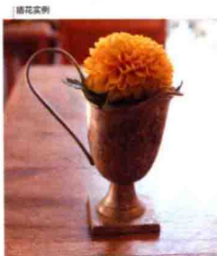
插花实例 高筒短茎圆球状开放的菊花，插在有黄铜色的花瓶上，给人一种伊斯坦布尔文化的氛围。在插花时要正好露出在唇部口上。