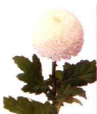
花型似小球，花色为白色，品种名“Super pink-pong”。