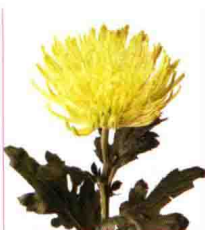
花开时细嫩的花瓣像站起来似的，品种名“Anastasiade-line”。