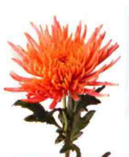
以菊花的印象焕然一新的“Anastasia”系列，品种名“Bronze”。