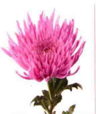
“Anastasia”系列，品种名“Pink”。花色不同给人的印象也不同。