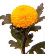
花型似小球，品种名“Piaget yellow”。避免附黄色给人一种朝气蓬勃的印象。