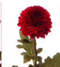
显得密密麻麻的花瓣像开放的大菊花似的，品种名“Velvete”，花色深红。