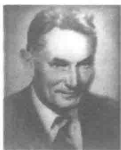
图 1-5 普多夫金