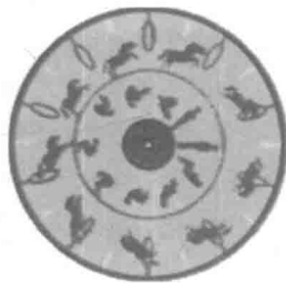
图 1-2 “诡盘”

“活动电影机”利用了光影原理和“视觉残像”原理。“视觉残像”是指对象投射在人的视网膜上形成影像,对象消失后,影像在视网膜上的感觉并不能马上消失,能够停留 0.1~0.4s。利用这种原理就是说如果以很快的速度播放一组图片,上一张图片还没有在人的视网膜上彻底消失,下一张图片就进来了。如果这组画面记录的是某一动作的顺序形态,那么在人的眼中看到的的就是这一动作的连续运动形态。根据这种原理,默片时期电影播放的速度是 16 格/s,