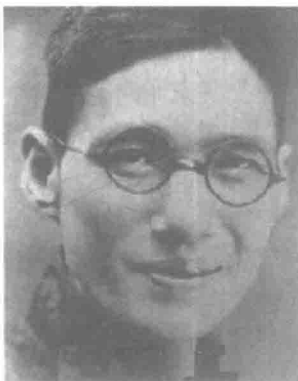
图 1-7 郑正秋

1913年,中国电影伟大的先驱者郑正秋(图1-7)与经营广告业务的张石川联合执导,拍摄了电影《难夫难妻》(又名《洞房花烛夜》),标志着中国第一部短故事片诞生。郑正秋,原名郑芳泽,号伯常,广东潮州人,生于上海。电影评论家出身的郑正秋是中国电影事业的开拓者,与张石川同属中国的第一代导演。