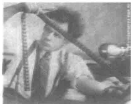
图 1-6 爱森斯坦