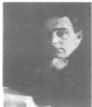
图 1-4 维尔托夫