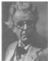
图 1-3 库里肖夫

苏联电影美学流派有四位代表人物:库里肖夫、维尔托夫、普多夫金和爱森斯坦。库里肖夫(图1-3)是一位甘当人梯的导师,培养了很多学生。库里肖夫喜欢在他的工作室里带领学生做剪辑实验,著有《电影导演基础》一书,在中国一直被作为影视院校师生的必备参考书。维尔托夫(图1-4)擅长做新闻电影,其著名电影作品叫《持摄影机的人》(1928年)。维尔托夫主张电影应该记录社会主义的现实,他认为日常生活比排演出来的戏更为精彩和真实。维尔托夫创立了“电影眼睛”理论。他把电影摄像机比作人的眼睛,甚至优于人的眼睛,主张电影工作者手持摄像机“出其不意地捕捉生活”,反对人为的扮演。普多夫金(图1-5)是库里肖夫的学生,他最著名的电影作品是《母亲》(1926年)。普多夫金创造了隐喻蒙太奇,他认为自然物体(或具体物体)能够传达一定的情感。爱森斯坦(图1-6)是蒙太奇学派中非常著名的人物,其著名电影作品叫《战舰波将金号》(1925年),片中著名的一幕叫“敖德萨阶梯”。爱森斯坦尤为强调镜头组接产生的新的含义,他认为任何两个画面相接都能够产生新的内涵。爱森斯坦创造了“知性蒙太奇”和“杂耍蒙太奇”,并将其概括为两个不同镜头的对立和冲撞都会产生新的含义。到这一阶段,蒙太奇理论已经建立,格里菲斯那个阶段对蒙太奇的探索基本属于实践行为,带有不自觉特征,而苏联电影美学流派经过很多人的努力在实践的基础上总结出完整的蒙太奇理论,属于自觉行为。苏联电影美学流派大致经历了十年的辉煌,其代表作品有:《罢工》(1924年)、《战舰波将金号》(1925年)、《母亲》(1926年)、《圣彼得堡的末日》(1927年)、《兵工厂》(1926年)、《持摄影机的人》(1929年)、《成吉思汗的后代》(1928年)、《总路线》(1929年)、《土地》(1930年)、《热情》(1931年)和《逃兵》(1933年)。