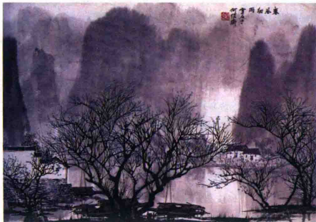
图 1-17 白雪石中国画《春风细雨》

在长期的社会演变中，由于美术与地域、政治、经济、文化传统、风俗习惯等关系十分密切，各国、各地区、各个民族在绘画上都有丰富的创造并表现出各自不同的特点。在世界范围内，美术可以粗略地划分为两大体系——东方体系和西方体系。东方体系中以中国的传统美术——中国画最具特色。中国画强调以线造型，讲究笔墨意境，它以中国人的思维方式和自己独特的方法来描绘生活(见图1-17)。西方体系则以西欧的油画为代表，它崇尚写实，主要运用明暗造型的手法，依据透视学、解剖学、色彩学和光学等理论来体现所描绘的对象，还具有表现人体美的艺术传统(见图1-18)。