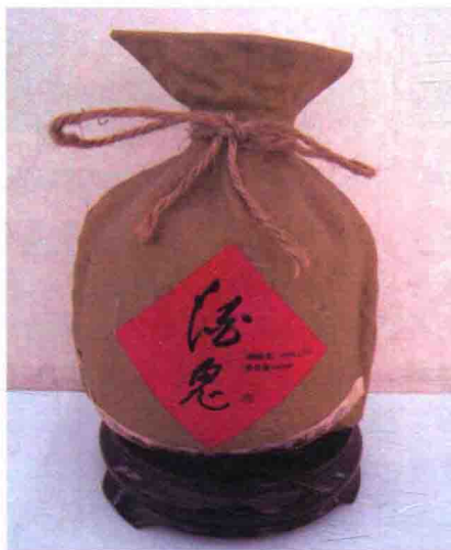
图 1-10 黄永玉设计的“酒鬼”酒瓶包装