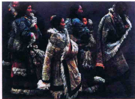
图 1-7 陈逸飞油画作品《山地风》(西藏题材)

然而，就是这么一位杰出的油画家，后来却从事了绘画以外的艺术创新。他极力提倡“大美术”“大视觉”，广泛地经营了网络、服装、媒体乃至电影等事业。陈逸飞把他所涉猎的各领域统称为“视觉产业”。他不赞同画家就该一辈子埋头作画，时代变了，越来越多的艺术家应该走出艺术的象牙塔。他认为现在的社会，许多东西都是跨专业的，这是社会发展的需要。他“只想让中国人尽快地生活在一个像样的视觉世界里”。他以艺术家的眼光，以视觉为主线，引领中国艺术界进入了艺术时尚时代，他也越来越乐于自称为“视觉艺术家”，并且在其他领域同样取得了巨大的成功。