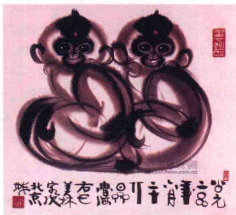
图 1-13 韩美林水墨画《猴》