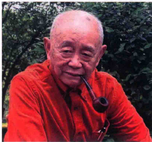
图 1-8 黄永玉

黄永玉博学多识，如国画、油画、版画、漫画、雕塑等这些美术中的十八般武艺，他几乎无所不能、无所不精(黄永玉的中国画《风颂》见图1-9)。黄永玉的木刻师法传统，装饰味极浓，他的彩墨画墨色淋漓，凝重洒脱，作品构思奇特，每有出新。他还设计了我国第一轮生肖邮票的首枚——猴票、家喻户晓的“酒鬼”酒包装以及他自己在家乡凤凰县的建筑和在北京的住宅万荷堂。