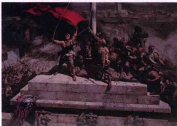
图 1-4 《攻占总统府》