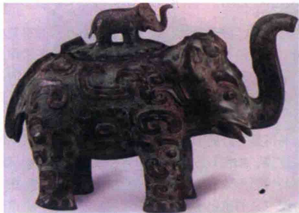
图 1-15 青铜器《夔纹象尊》

代工业产品的审美价值关系更加密切，它体现出一种独特的材质肌理美。图1-15所示的青铜器《夔纹象尊》，图1-16所示的陶瓷器的精工造型和灿烂彩釉都给我们一种材质美的享受。