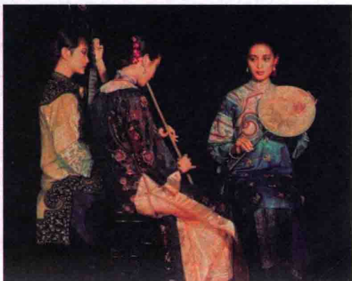
图 1-5 陈逸飞油画作品《浔阳遗韵》