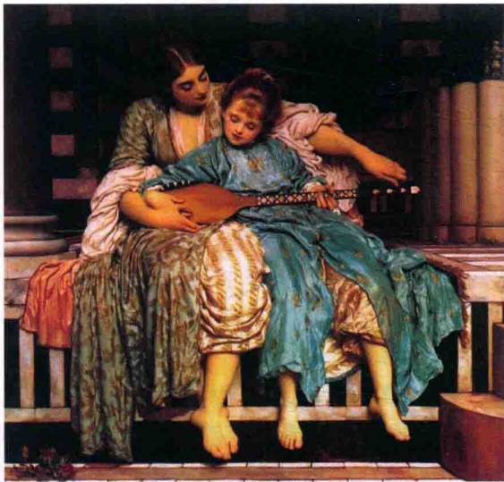
图 1-14 莱顿的《音乐课》

美术的艺术语言非常丰富,以绘画为例,通常包括线条、形体、色彩、明暗、空间、构图等造型手段。绘画就是用这些艺术语言,在二维空间的平面上塑造可视的艺术形象,反映客观事物和表达思想感情,例如19世纪英国画家莱顿的《音乐课》(见图1-14)。莱顿以极其严谨的态度描绘了音乐课的情景,女教师微微俯身帮助女孩调试琴弦,女孩则依偎在女教师胸前弹拨着六弦琴。这只是一幕普通的音乐课情景,却被画家描绘得极富美感韵味。女教师面庞秀美清丽,身着长裙,花纹、质地被画家描绘得十分逼真;小女孩则被描绘得天真烂漫、纯真无邪,表情认真,显得十分可爱。衣服、面部及背景的描绘都栩栩如生,表现着内在的充实和生活的情趣。