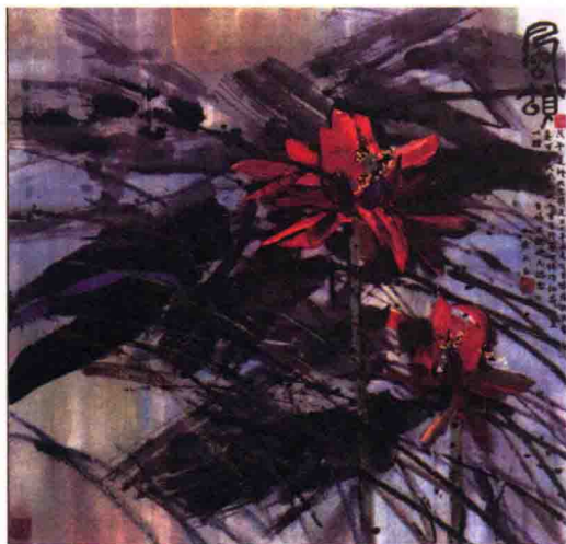
图 1-9 黄永玉的中国画《风颂》

“酒鬼”酒包装设计成功在于它的出类拔萃、鹤立鸡群。它的麻袋造型和麻袋纹理符合了湘西乡土的文化属性，同时也反映了内在的商品品质，确实是一个具有文化品位、富有个性的设计。这当然与充当了设计师的黄永玉的酒瓶设计是分不开的，这也就是“大美术”概念的一个见证。