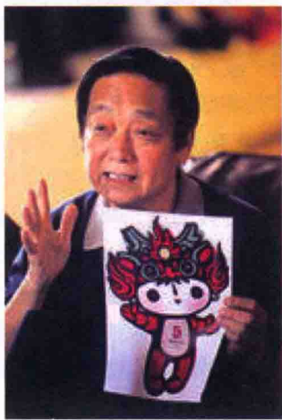
图 1-12 韩美林与福娃设计稿

现在我们明白了“大美术”并不是传统的绘画概念，“大美术家”也不一定是指“有名”的画家，而是指多才多艺的艺术家。当然，以丰硕的成果也可以成就像陈逸飞、黄永玉、韩美林这样有名的“美术大家”了！