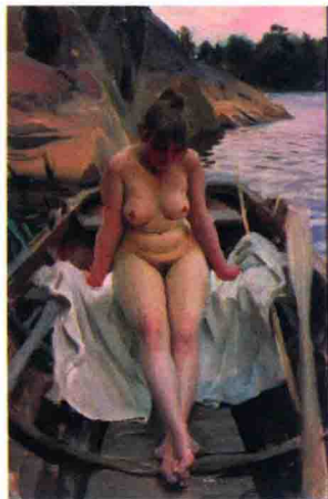
图 1-18 瑞典佐恩油画《在沃纳划的船上》