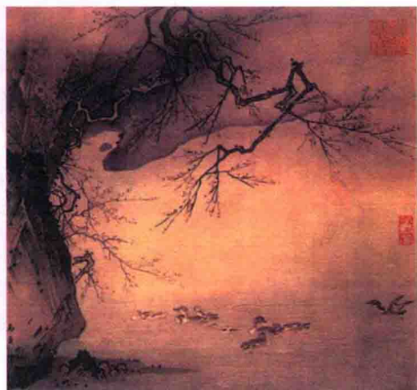
图 1-1 (宋)马远《梅石溪凫图》

传统上,人们认为美术就是指观赏性的艺术,如绘画、雕塑等(见图1-1、图1-2)。