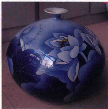
图 1-16 现代瓷器