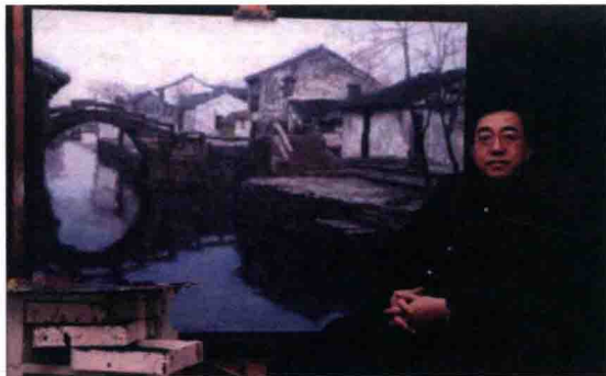
图 1-6 陈逸飞与他的油画《双桥》