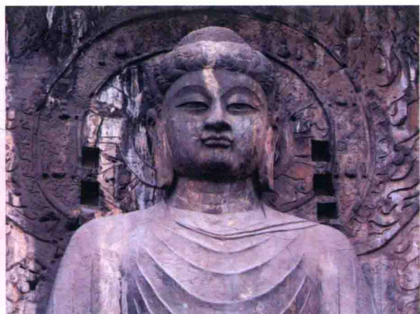
图 1-2 河南洛阳龙门石窟雕像(局部)

所以,一说到美术,人们通常认为就是指绘画。其实,随着美术与人们生活越来越密切的联系,美术的范畴已经包括了满足人们实际需要,同时又具有一定审美价值的各种实用艺术,如工艺美术、建筑艺术和园林艺术等。随着现代生活时代的到来,人们对美术的感知越来越宽泛,现代生活质量的提高使人们对美的需求也越来越高。即便是专业美术工作者,也在不断兼收并蓄各种实用美术形式,将纯艺术融入到现代生活中去。因此,现代美术的范畴已经涵盖了更大的领域,具体包括诸如中国画、油画、版画、水彩画和漆画等传统绘画,也包括传统的雕塑、手工艺术、民间艺术,还包括现代设计,诸如环境艺术设计、平面设计、工业产品设计、影视动漫设计和综合材料艺术、行为艺术、装置艺术等内容,这就是我们现在所说的“大美术”。