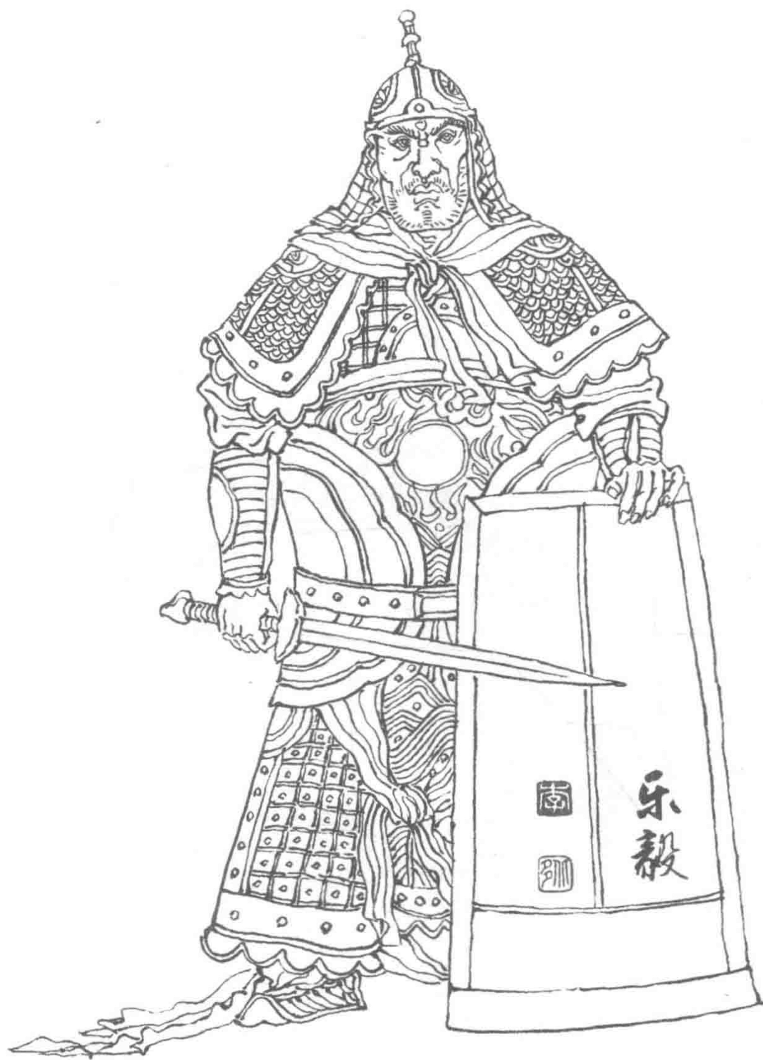
乐毅： 战国时燕将，杰出的军事家。他统帅燕国等五国联军攻打齐国，连下七十余城，因功封于昌国，号昌国君。