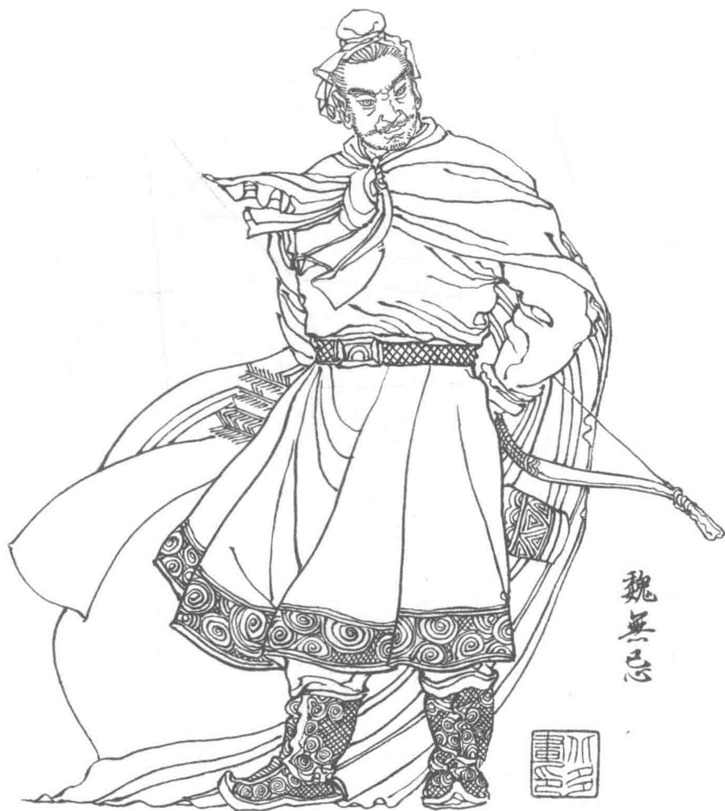
魏无忌： 战国时期魏国贵族，号信陵君，战国四公子之一。秦围赵都邯郸，他用计窃得兵符，夺取兵权，救赵胜秦。后又联合五国击退秦将蒙骜进攻。