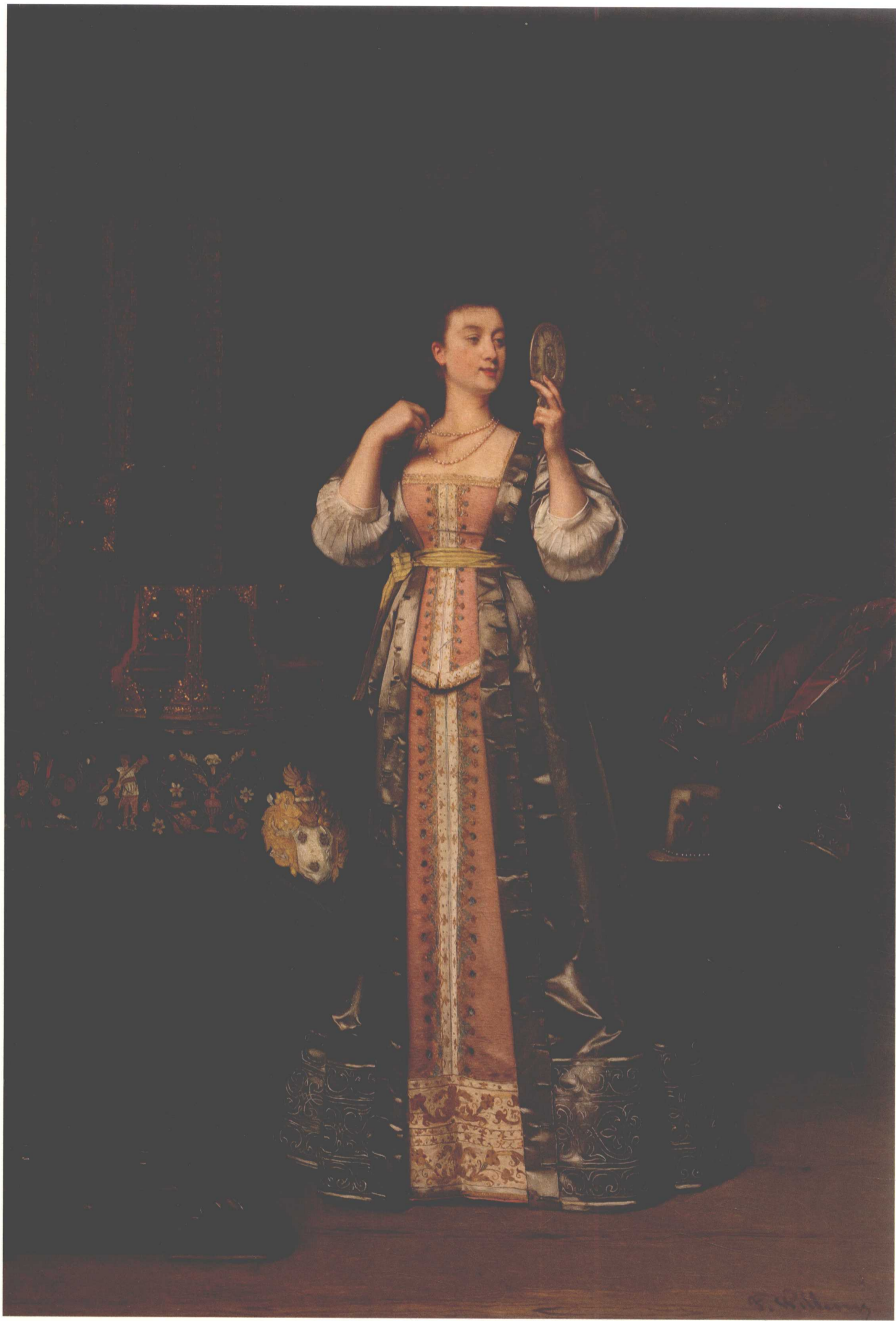
[比利时] 弗罗伦·威莱姆斯 Florent Willems