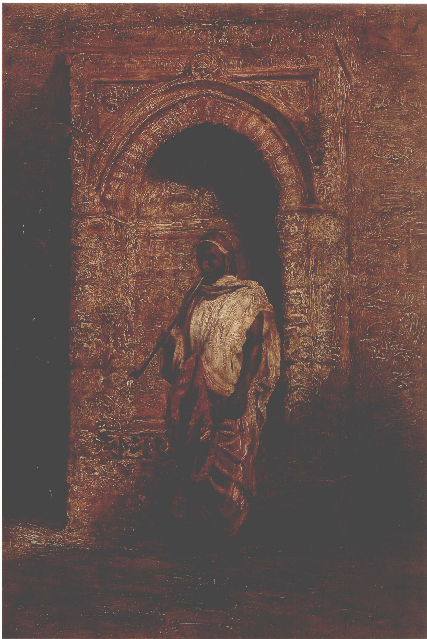
[西班牙] 马里亚诺·福图尼 Mariano Fortuny