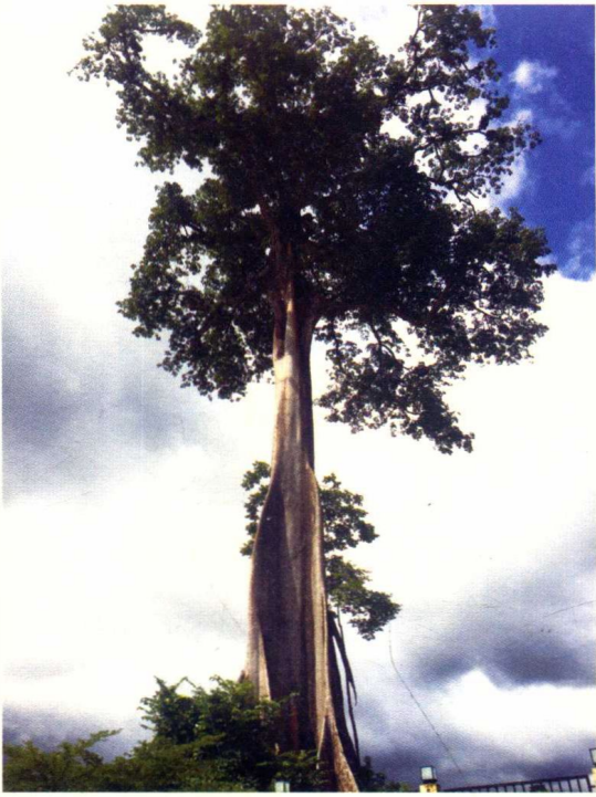
国树——木棉