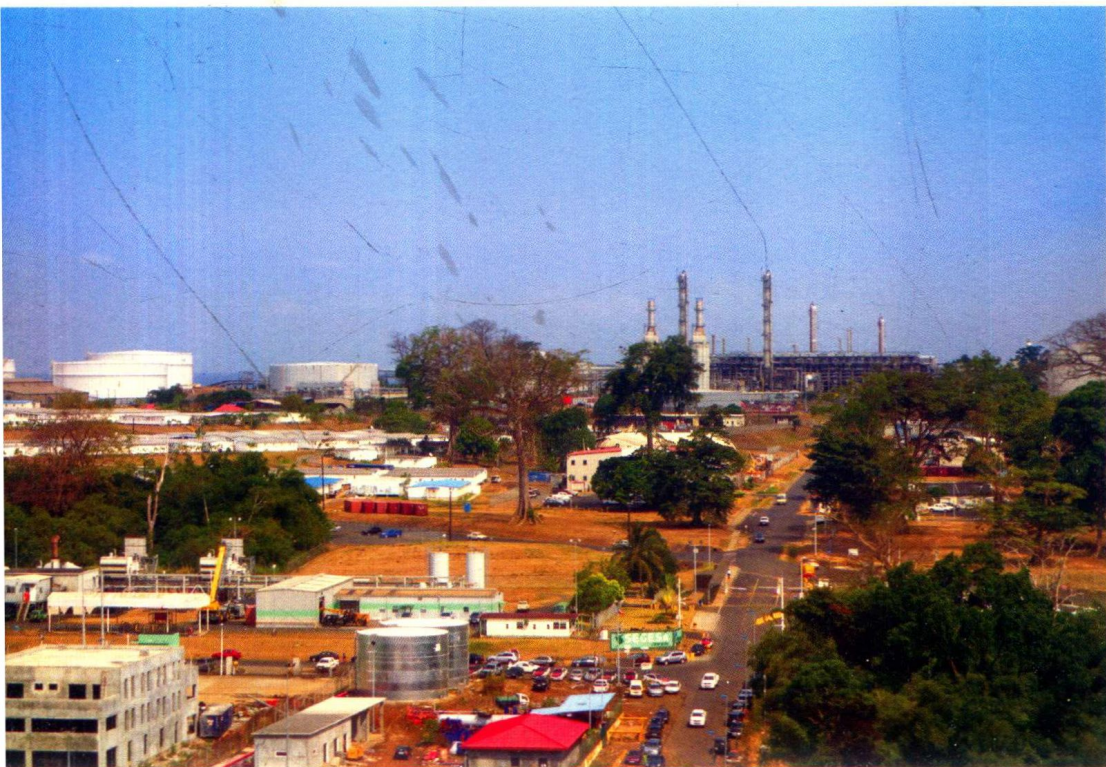
首都马拉博西波波