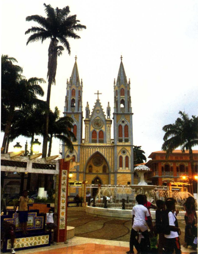
马拉博大教堂