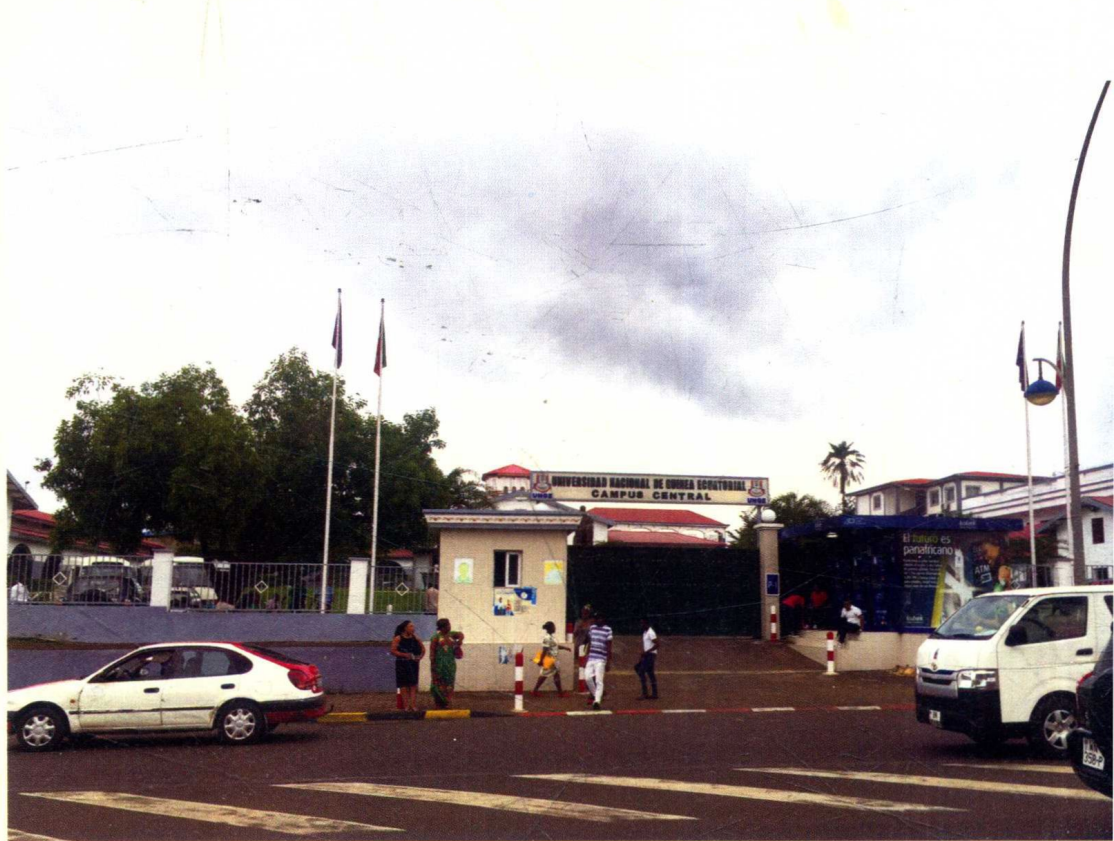
赤道几内亚大学校门