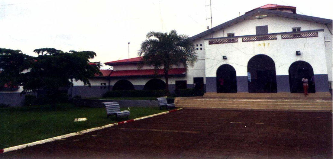
赤道几内亚大学校园内景