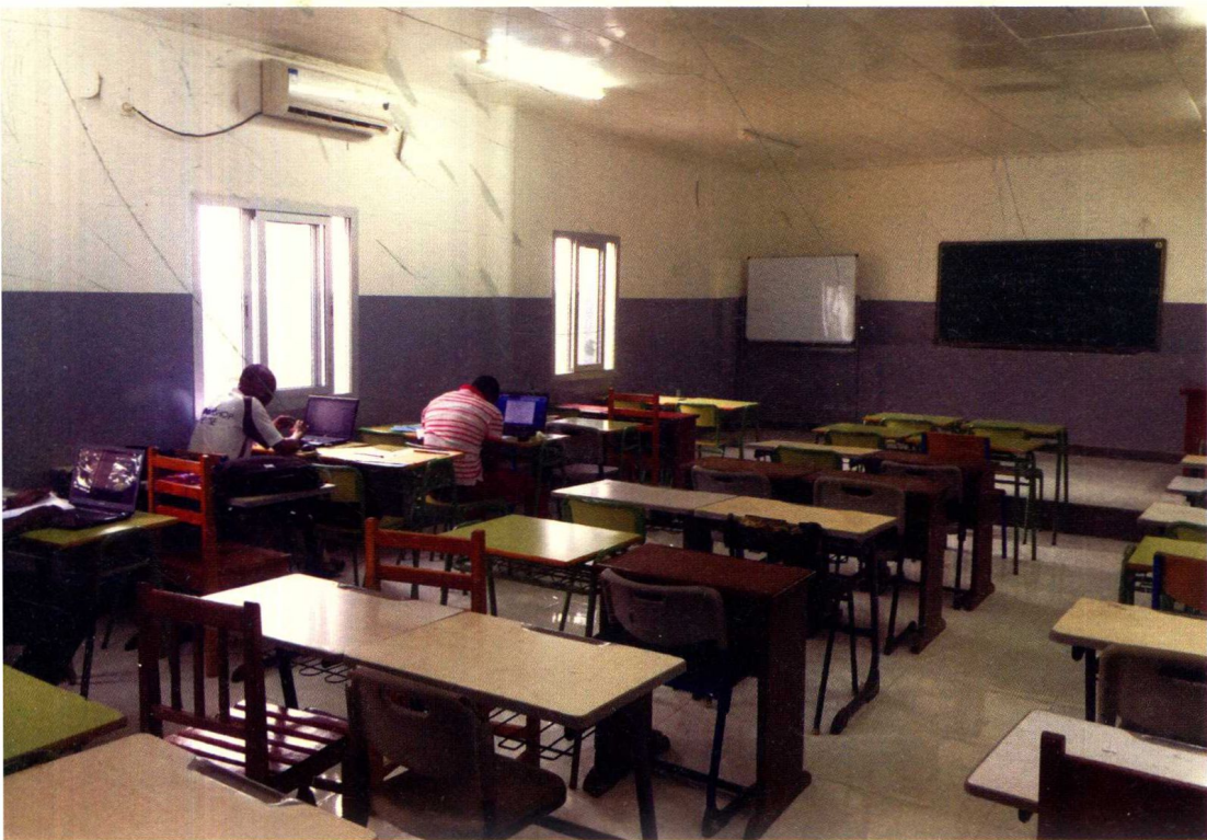
赤道几内亚大学教室