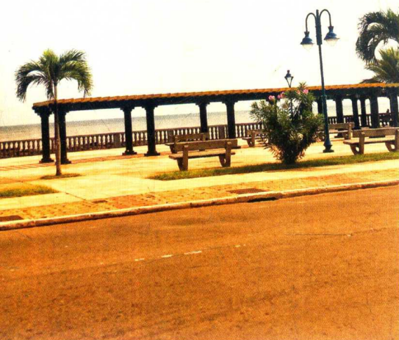
巴塔的海边公路