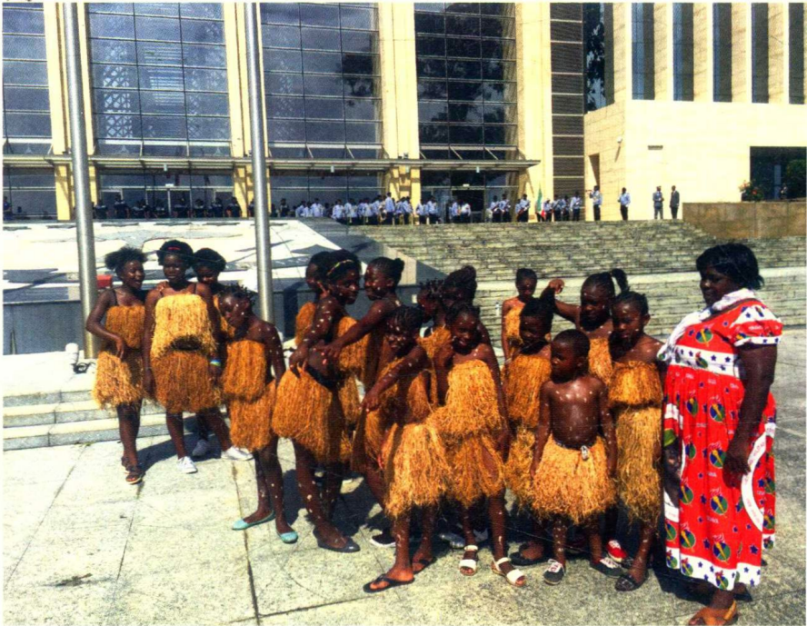
跳草裙舞的孩子们