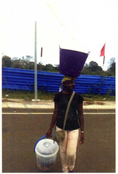
首都马拉博郊区卖食物的女人