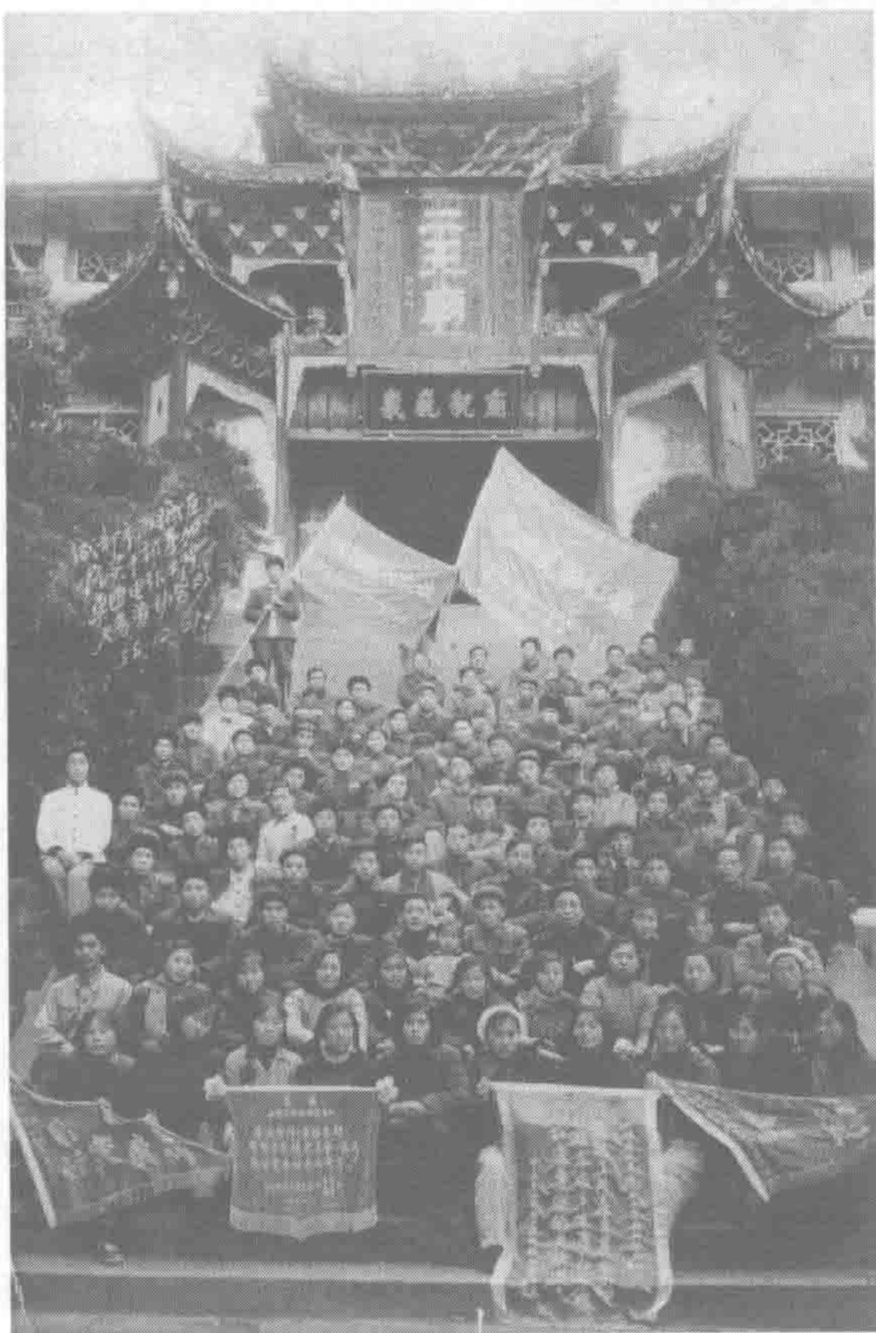
1958年成都西城区机关干部参加都江堰鱼嘴电站工程义务劳动

障，又开凿西北濠，汇笕槽河与磨底河水，沿罗城西面，流到甘亭庙（今宝云庵附近）汇入锦江，合流处被称为百花潭。原来的内江（郫江）也就逐渐干涸。二江并流的景观也不复存在。