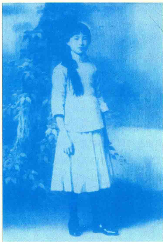
林徽因一九一六年于北平