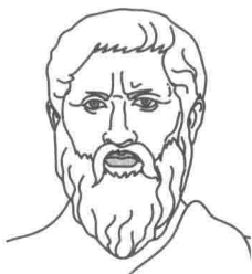
柏拉图 (公元前 427—公元前 347)