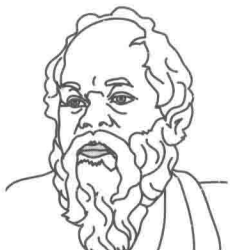
苏格拉底 (公元前 470—公元前 399)