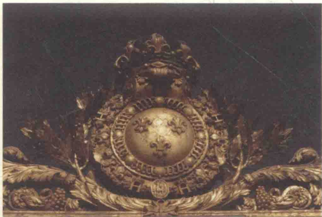
► 凡尔赛宫门柱上闪耀的波旁家族的家徽