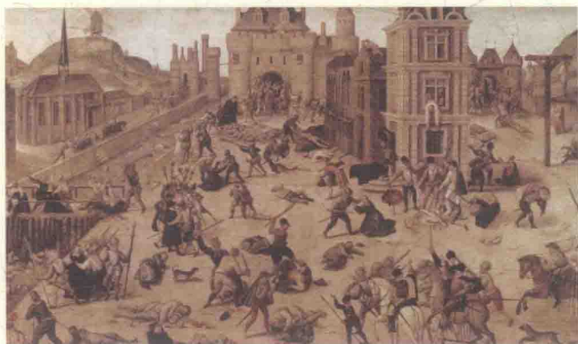
▶圣巴托洛缪大屠杀

这就是天主教与新教之间以血洗血的“胡格诺战争”。战争几经起落，旷日持久。国内的领主纷纷举起各自教派的旗号，与反对派冲突不断，导致国土沦为焦土。