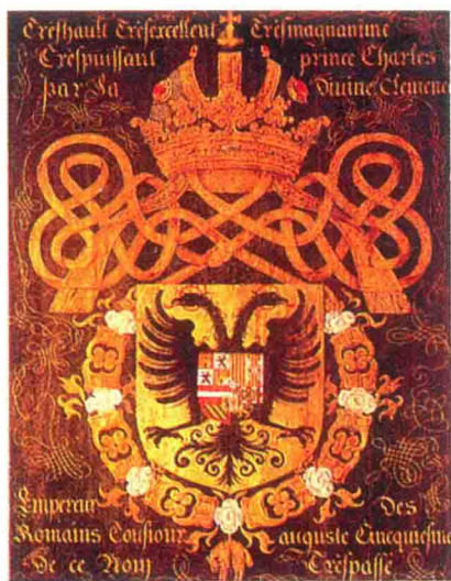
► 查理五世的纹章（绘有哈布斯堡家族的双头鹰族徽）