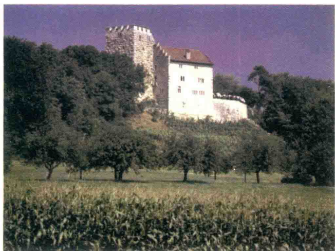
▶ 现存的哈布斯城堡