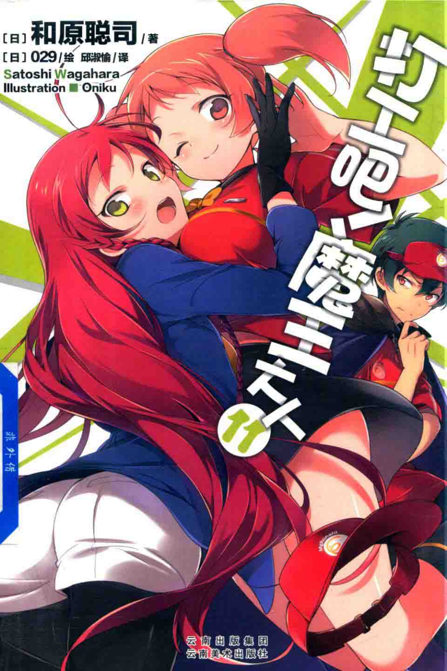
Illustration ■ Oniku