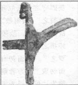
西周·人头盔戟 通长25.2厘米，1972年甘肃灵台白草坡二号墓出土，甘肃省博物馆藏。

夫为国之道 ① ，恃贤与民。信贤如腹心，使民如四肢，则策无遗。所适如支体相随 ② 、骨节相救，天道自然 ③ ，其巧无间。