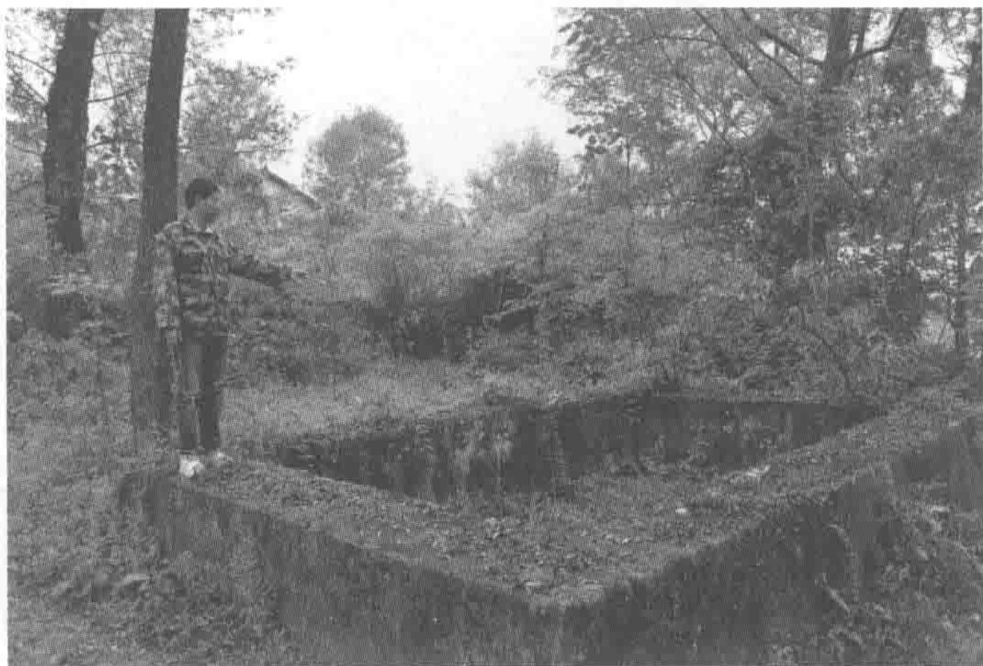
当地村民指认现场