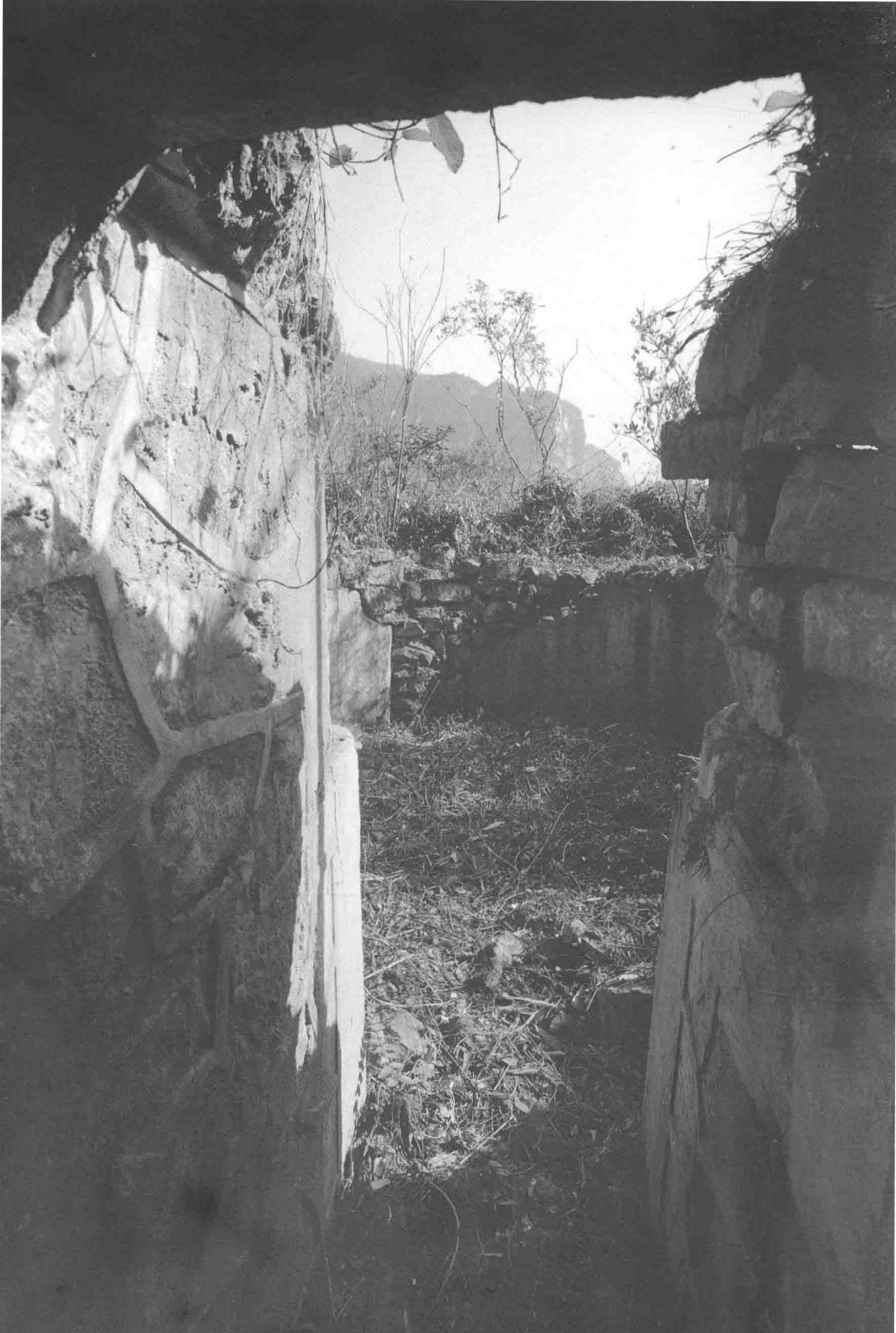
国军炮台