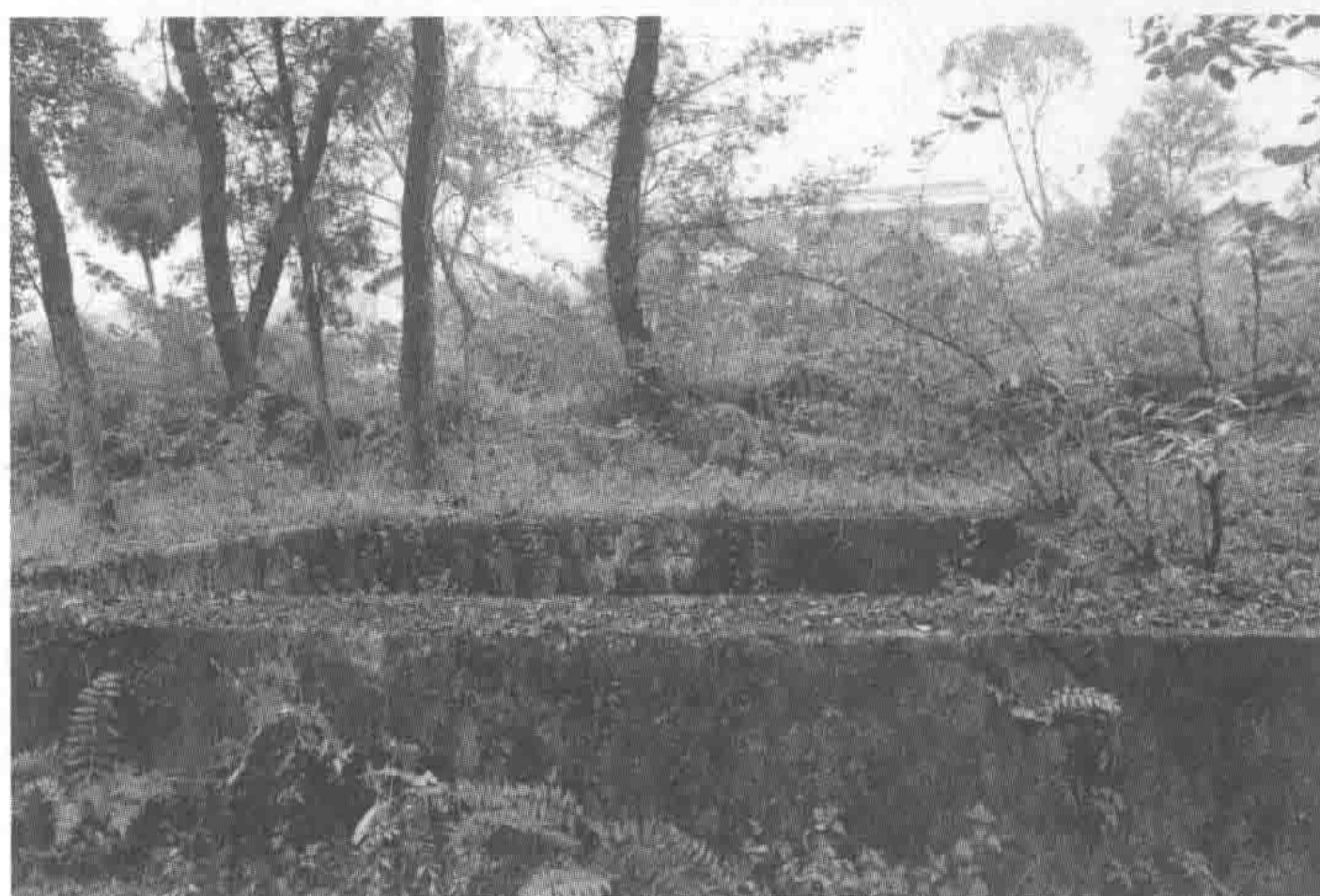
该池后方白色建筑为当地学校。