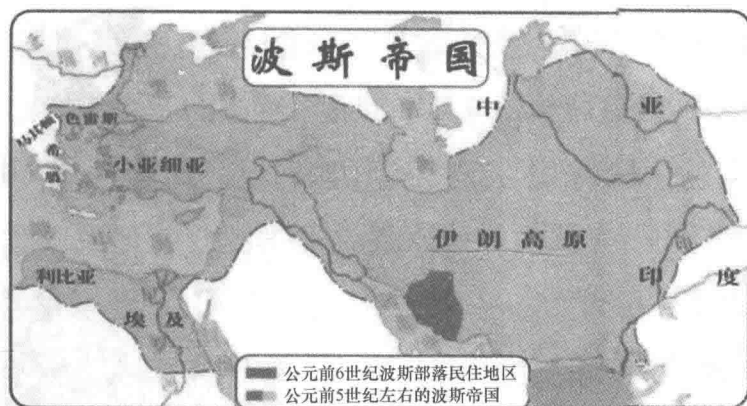
图2 古代波斯帝国疆域

74.6%，年龄中位数是30.1岁。 ① 根据世界银行的统计，伊朗平均寿命为75.7岁，生育率1.7%，城镇人口增长率1.9%。 ② 伊朗人口超过百万的城市有6座，分别是德黑兰（770.5万人）、马什哈德（241.1万人）、伊斯法罕（158.3万人）、大不里士（137.9万人）、设拉子（120.5万人）、库姆（104.2万人），阿瓦士和克尔曼沙的人口也都超过了50万人，分别为79万人和64.3万人。 ③