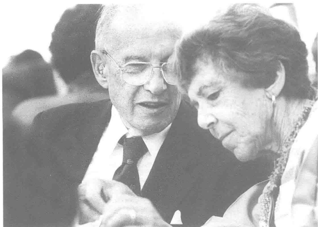
彼得·德鲁克和妻子多丽丝·德鲁克