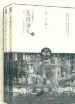
美国语文 (双语插图版) 【美】威廉·H·麦加菲 著 9787214127600