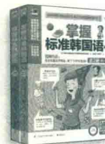
掌握标准韩国语2(全2册) 【韩】祥明大学国际语言文化教育学院教材开发部 著 9787553755915