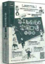
每天都在说的实用 口语大全集 【美】德米戴克英语研究机构 著 9787553762814