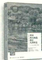
世间所有相遇，都是久别重逢—— 纪伯伦散文诗选 【黎巴嫩】纪伯伦 著 9787553754741