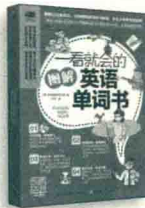
一看就会的图解 英语单词书 【韩】英语教材研究院 著 9787553763378