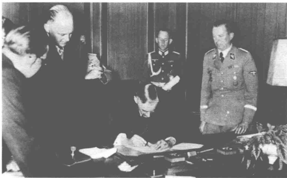
张伯伦首相签署《慕尼黑协定》。张伯伦身高6尺，在签署时弯下身体的样子被镜头捕捉下来，这似乎也是英国向德国纳粹俯首的象征。