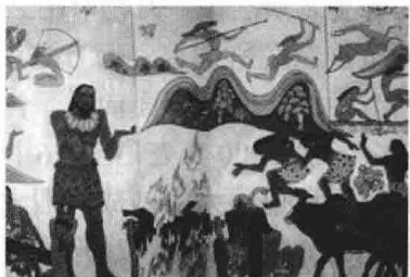
图 1-2 伏羲教民渔猎

太昊元年九月初五,在古宛丘(现河南淮阳),太昊伏羲氏实现了华夏九大部落首次结盟,结联盟,定一统,成为远古华夏第一位帝王。他和女媧为兄妹,结为夫妻,始生子民。太昊伏羲氏在华夏九州肇始了“制嫁娶,正