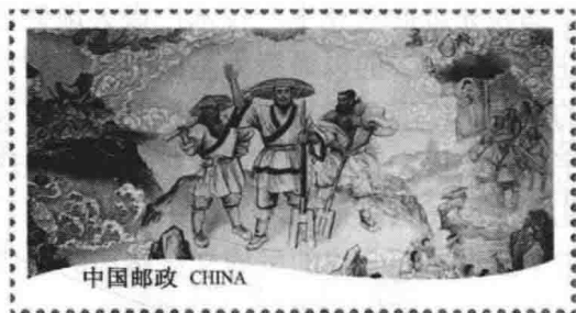
图 1-3 大禹治水

禹作为夏王朝的第一代国君，文武并治，一方面奉行德治，注重以道德、教化、礼仪使诸侯和百姓臣服，以家族与宗族制为纽带，依靠“忠孝”等基本伦理道德来维系社会关系。“天命禹敷土，随山浚川。乃奉执征，降民鉴德。乃自作配飧，民成父母”（《大禹赋》）（见图 1-3）。大禹在导九河入海的治水过程中，将治水与治国、敬民、养民、教民相结合。另一方面用军队、监狱、刑罚镇压不服从者。