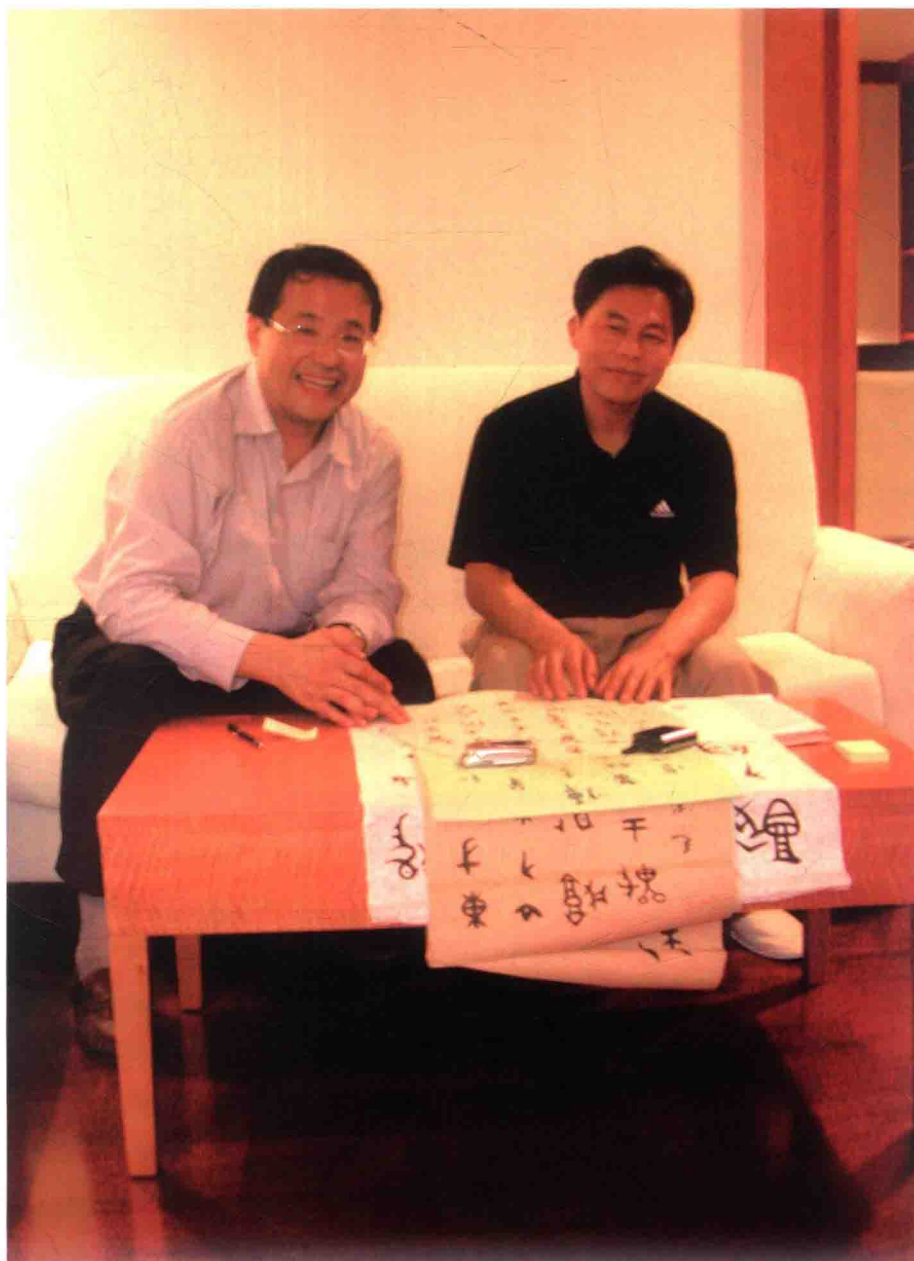
作者許思豪求教於安徽大學原校長、中國文字學會會長、著名古文字學家、博士生導師黃德寬先生