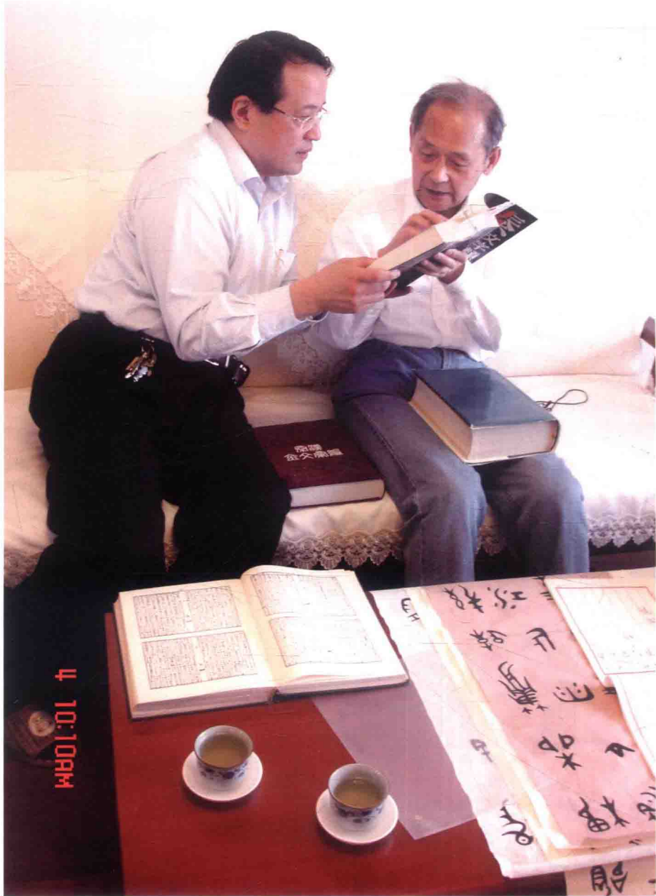
作者許思豪求教於著名古文字學家、院士級教授、復旦大學 博士生導師裘錫圭先生（右）