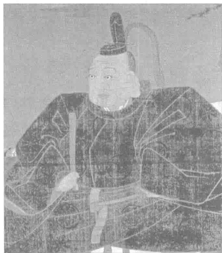
德川家康（日光东照宫收藏）