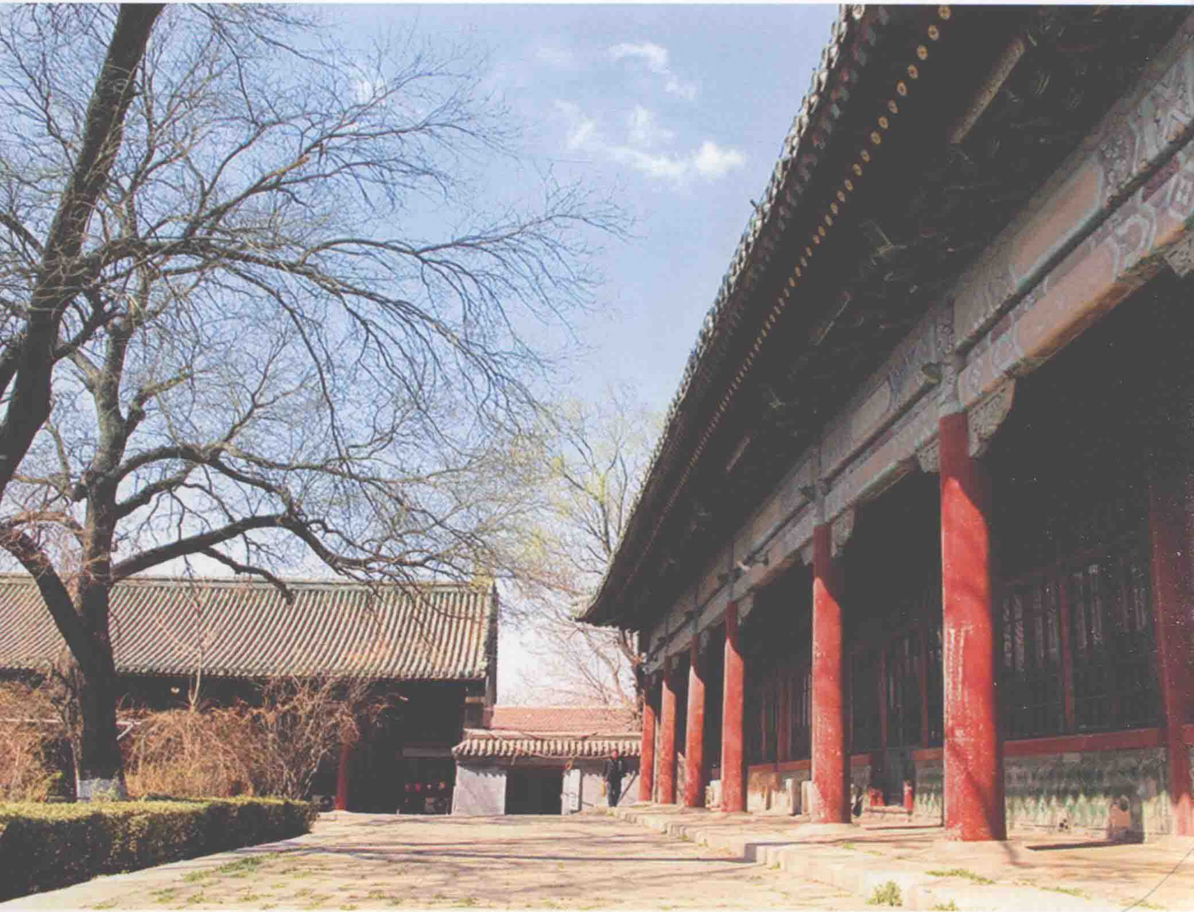
研究所旧址：北京市东城区朝阳门内大街137号孚王府