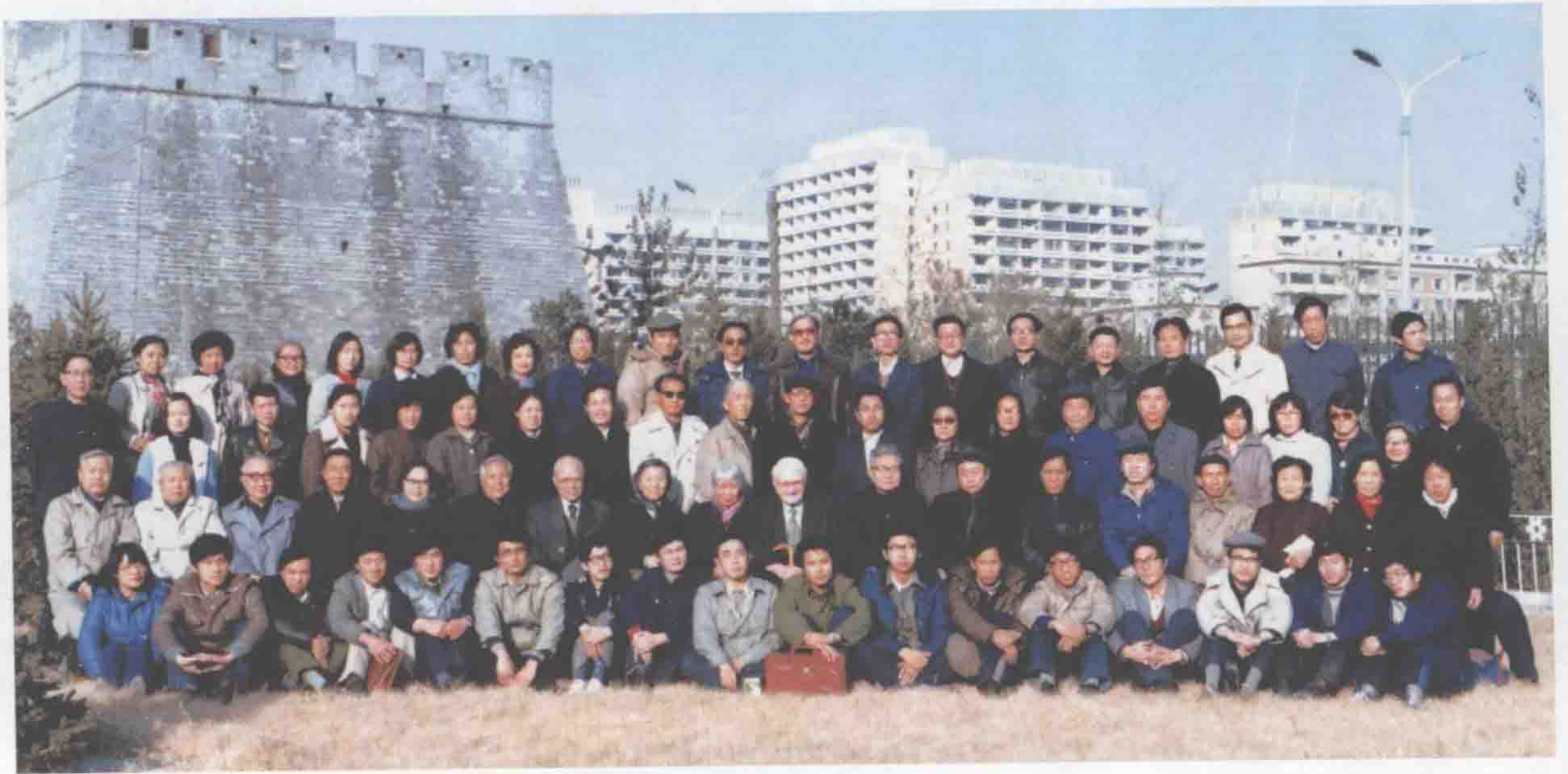
李约瑟与自然科学史研究所同事合影（1986年11月）