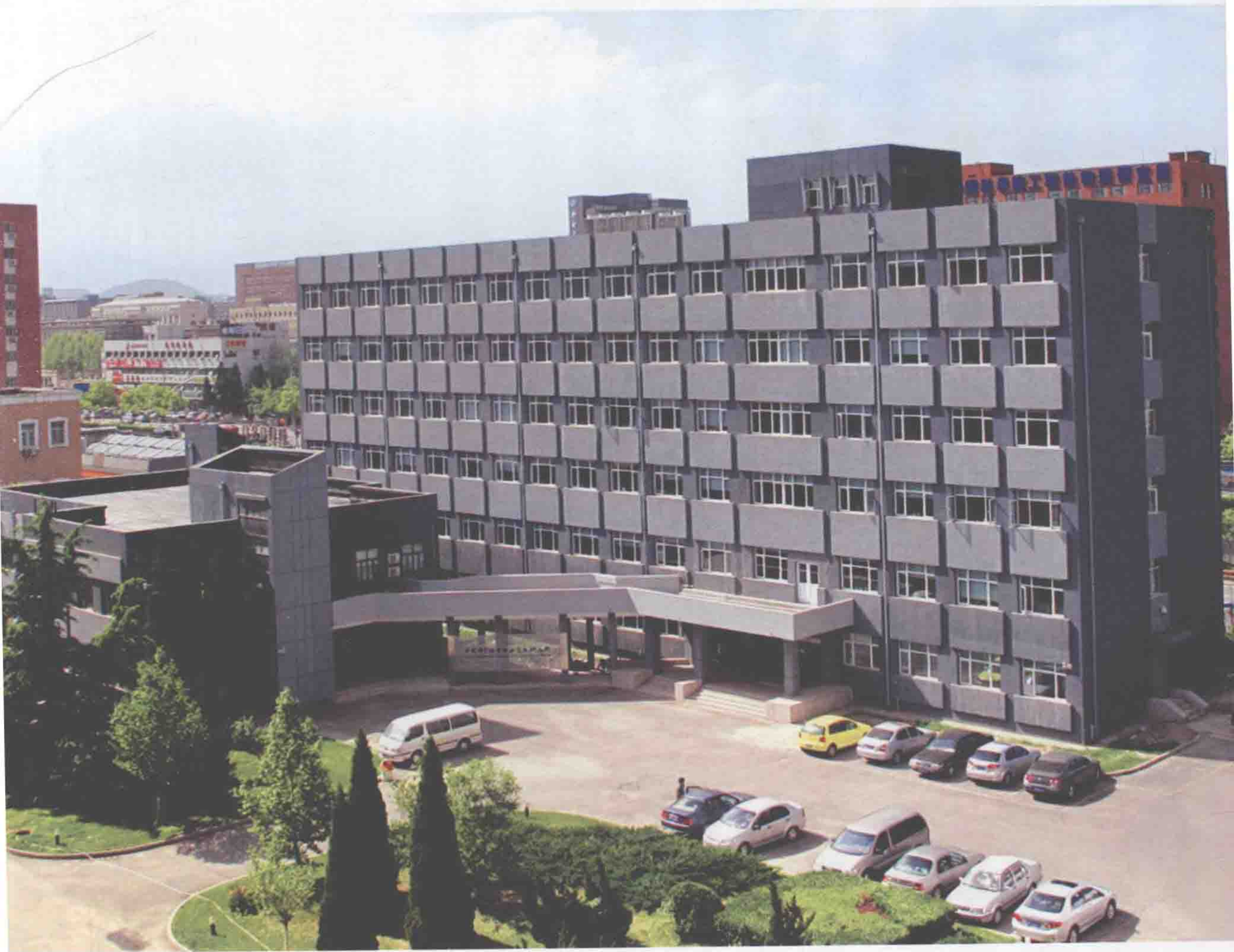
研究所新址：中国科学院基础科学园区