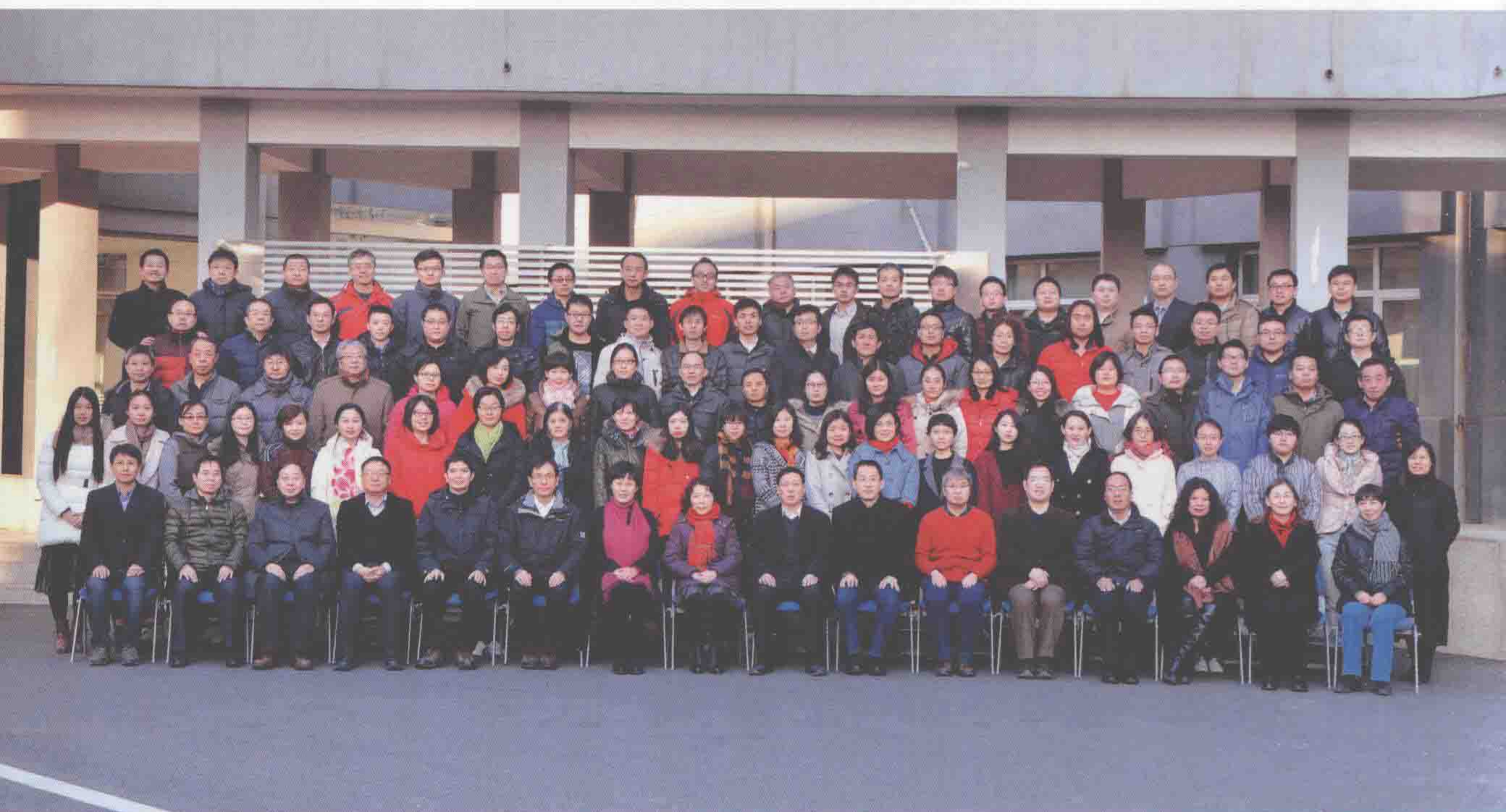
建所60周年纪念合影（2016年）