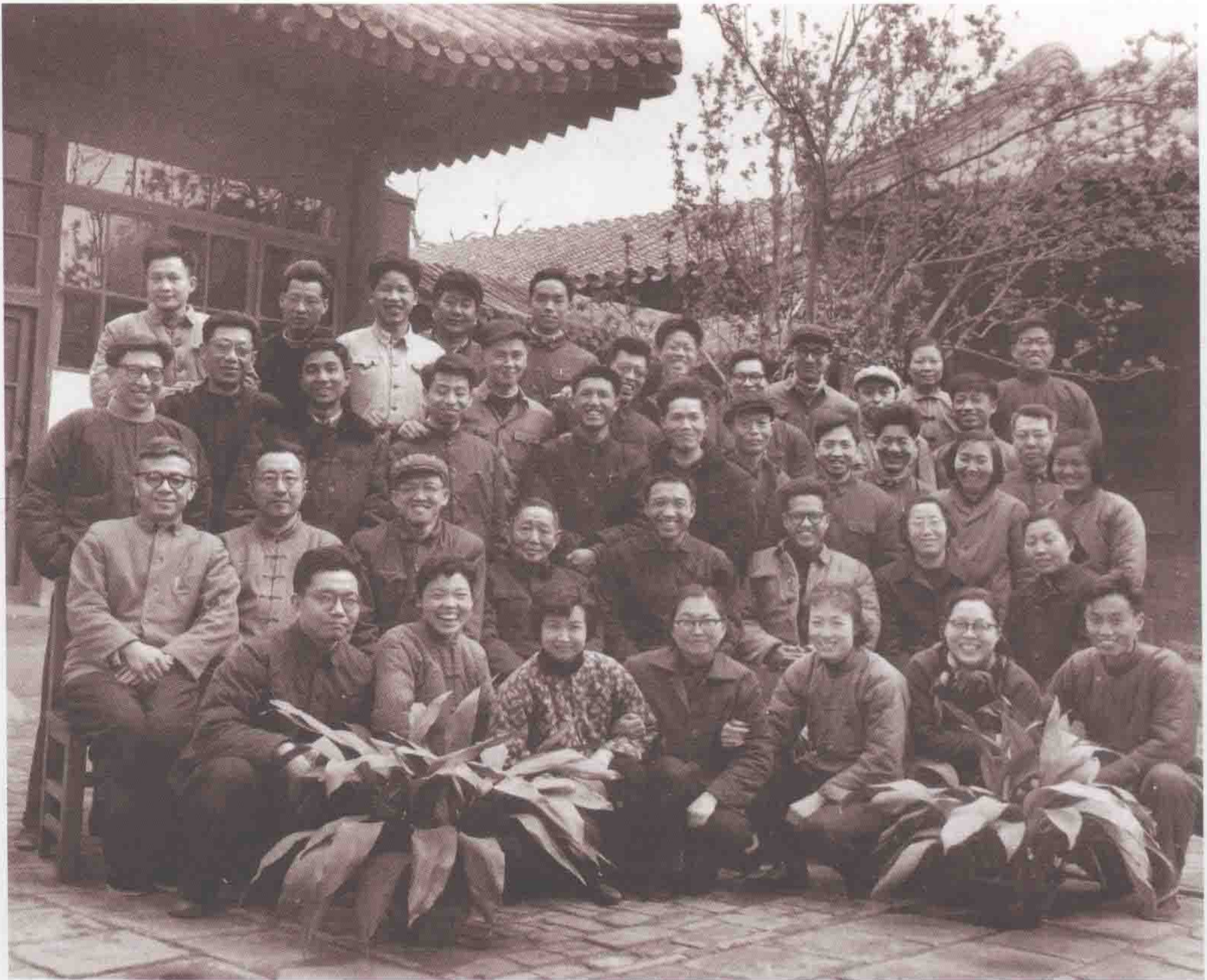
1966年4月全室职工合影