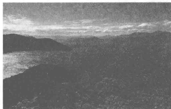
图 1-2 景观 2：水体