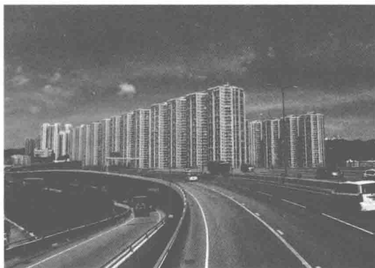
图 1-7 景观 7: 都市居住景观