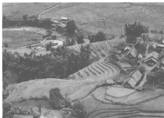
图 1-5 景观 5: 乡村田野