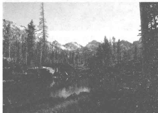
图 1-1 景观 1：自然旷野与森林

自然景观的演变，除了其自然因素及其自身的演替外，主要是伴随着人类的出现、活动、利用、开发、破坏而发生改变，至人类的活动开始，人与自然就紧密地联系在一起，相互作用，相互影响，从自然界最初的原始大地、森林、海洋、湖泊开始，历经了不同时期生产力的发展与变革，导致了人类活动与自然环境之间在不同阶段形成了特定的景观单元及复合体。以人类的起源、发展为线索，目前有学者将人与自然形成的景观划分为如下内容：