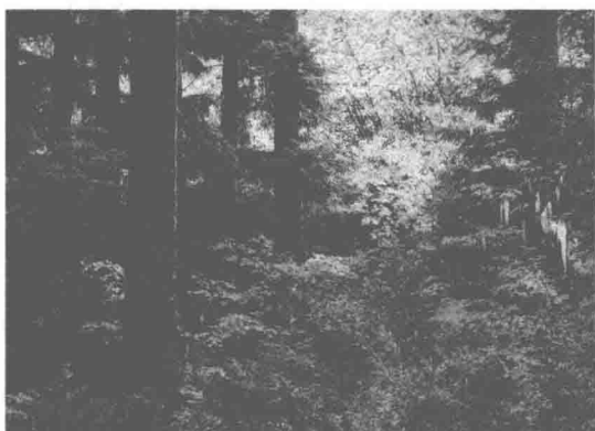
图 1-3 景观 3：森林