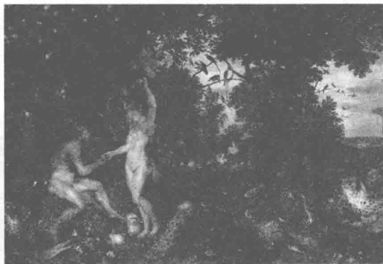
图 1-8 古希腊神话中的伊甸园

在西方，古希腊神话中的爱丽舍田园和基督教的伊甸园，都为人们描绘了天使在密林深处，在山谷水涧无忧无虑地跳跃、嬉戏的欢乐场景；佛教的净土宗《阿弥陀经》描绘了一个珠光宝气、莲池碧树、重楼架屋的极乐世界；伊斯兰教的《古兰经》提到安拉修造的“天园”，“天园”之内果树浓郁，四条小河流淌园内，分别是纯净甜美的“蜜河”、滋味不败的“乳河”、醇美飘香的“酒河”和清碧见底的“水河”。这些神话和宗教信仰表达了人们对美好未来的向往，也对园林的形成有深刻、生动的启示，周维权先生曾指出，伊斯兰教的《古兰经》有关“天园”的旖旎风光便成为后来伊斯兰园林的基本模式。