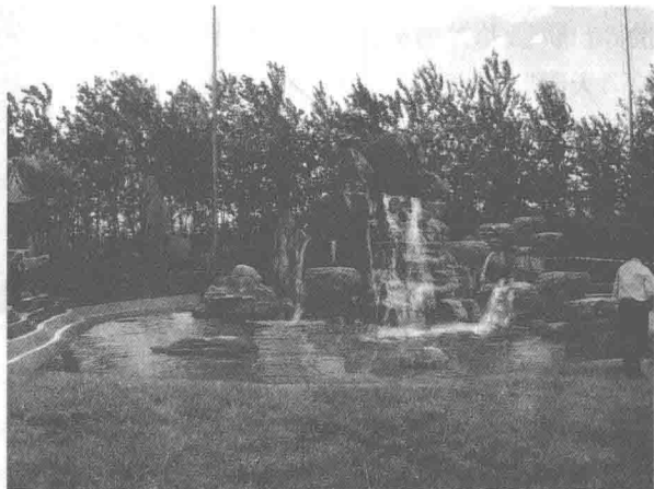
图 1-9 大型人工山水园是模拟自然山水关系而建立的

在大型人工山水园中挖湖堆山的山水布置，是模拟自然山水关系而建立的，遵循“山脉之通按其水境，水道之达理其山形”的自然之理，来确定山水骨架，因地制宜地形成“水得地而留，地得水而柔”的山水相依，山环水抱的自然环境。山水景观设计选取山岳的组成元素：峰、峦、洞、谷、悬崖、峭壁等形象和水体如河、湖、溪、涧、泉、瀑，应用天然山岳、自然水体构成的规律，进行山体组成元素、水体的组合，创造出合乎自然之理，具有天然之趣的山水环境。