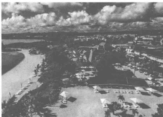
图 1-6 景观 6: 旅游度假地景观