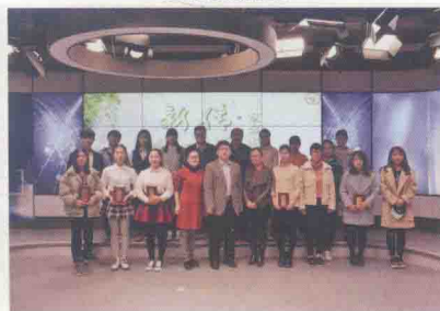
参赛选手与评委合影留念