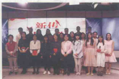
参赛选手与评委合影留念