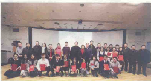
参加总决赛的选手与出席活动的领导、评委合影留念