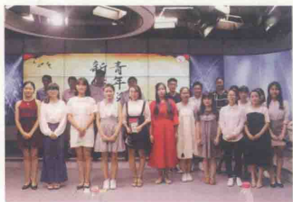
参赛选手与评委合影留念