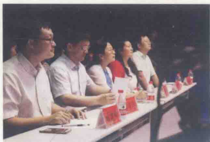
评委认真聆听选手们的精彩演讲