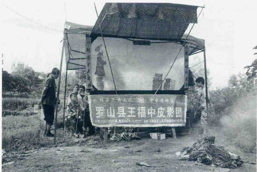
一个在唱愿戏的皮影戏班