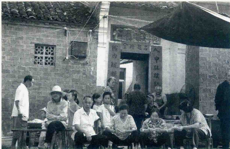
村民们边等待开饭边看皮影愿戏演出

化地影响着当地民众心理行为和民风民俗的形成。如果许愿达到了目的,那就必须还愿,即使不能亲自到灵山进行还愿,但请一台皮影戏演出表达还愿的愿望,对普通民众来说,还是非常普遍的。久而久之,在当地就形成了请皮影唱家庭愿戏的传统。