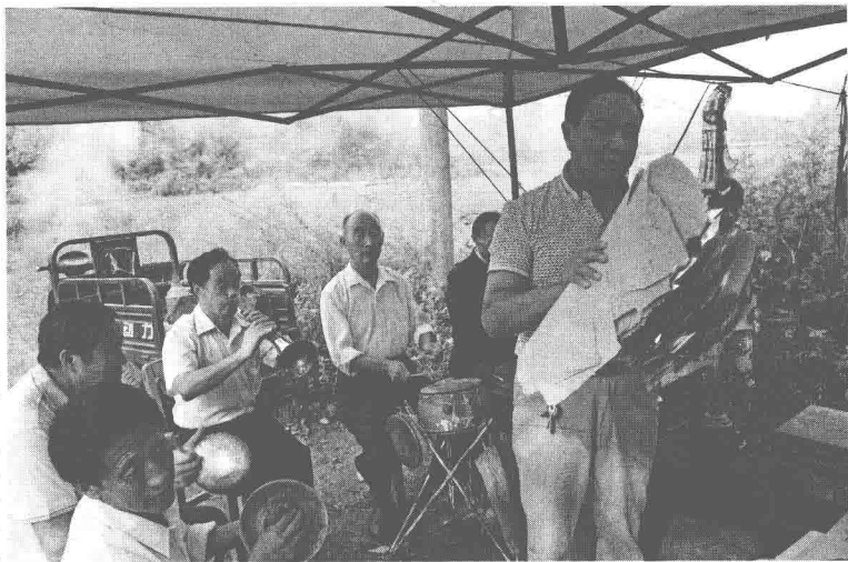
皮影艺人在唱愿戏

罗山皮影的每一个演出单位(俗称为“一担箱”)就是两只木箱子,分为“头箱”和“脚箱”。凡是皮影和所用的皮影道具都放在“头箱”,“脚箱”则放置锣鼓和演员们的物品。每逢外出演出,便可一人用一根扁担挑起两只箱子,另一人