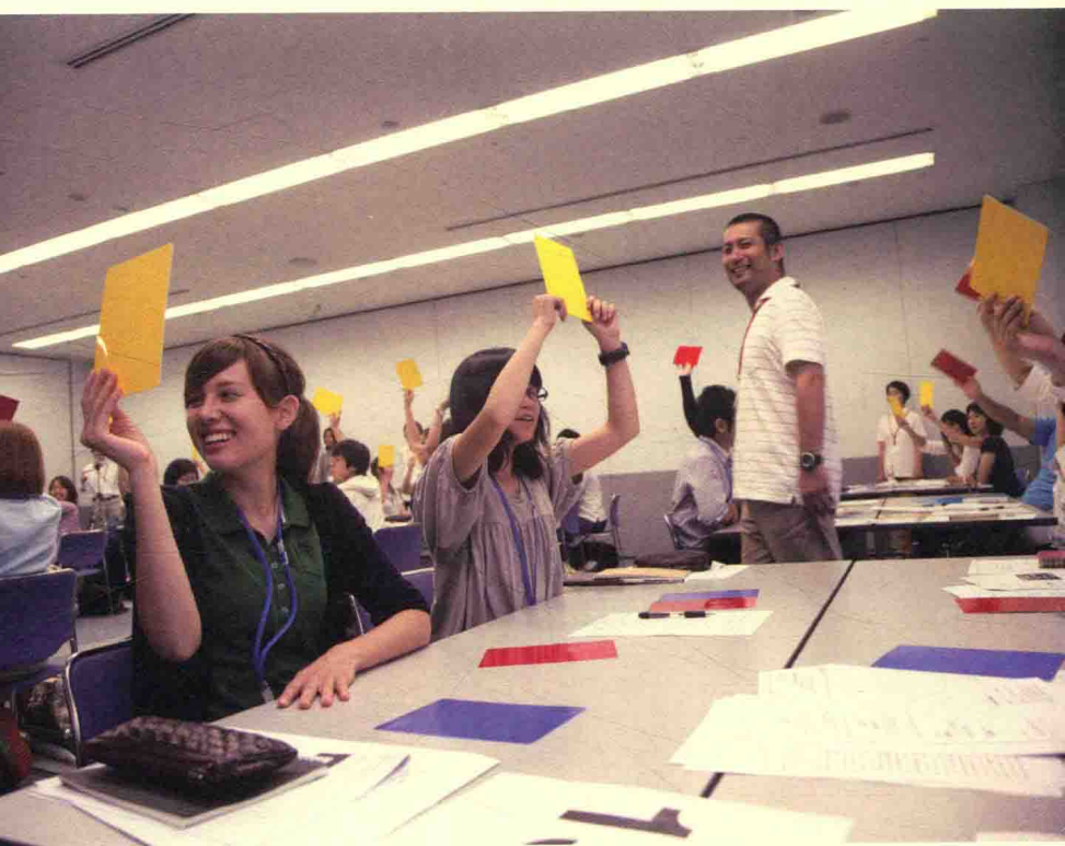
在“放学后 +design”专项中，与参加的学生们共享有关孩子的问题。（+design 专项）