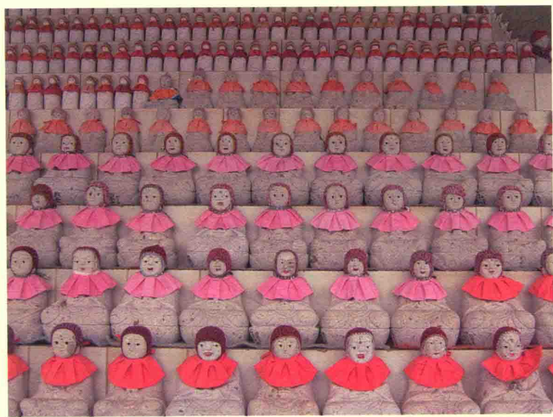
在“探索岛屿”专项中看到的万体地藏苑中的地藏菩萨塑像。(兵库家岛专项)