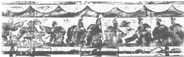
图3 山东嘉祥武氏左右室第三石画像