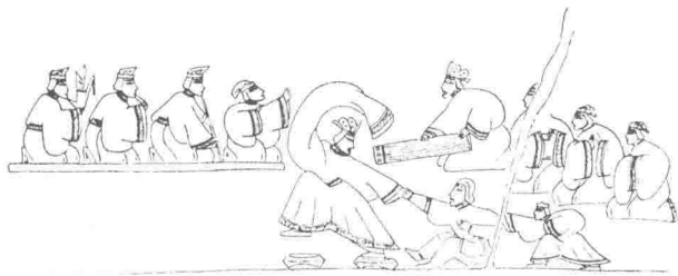
图2 山东隋家庄画像